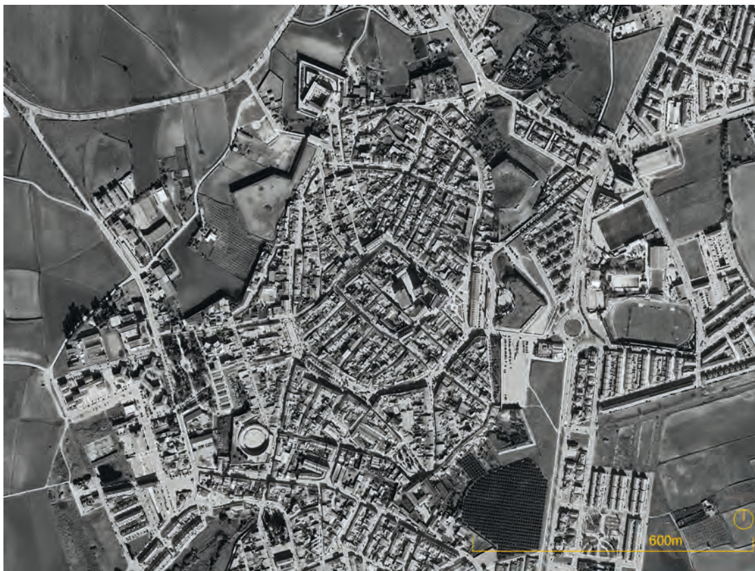
Figura 5. Vista aérea de la Plaza Fuerte de Olivenza. Antigua fortificación portuguesa en Extremadura.