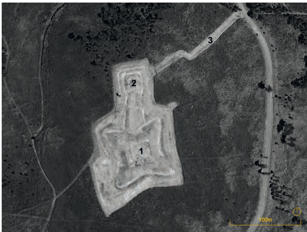
Figura 4. Vista aérea del Forte de Bragandelo. Fortificación de campaña del Subsistema Extremo, compuesta por: 1. Forte, 2. Atalaya y 3. Trincheras que conecta el fuerte al Forte de Pereira. (Rodrigues, 2024. Esquema original adaptado de Google Earth, 2024)

7 atalayas (6 PT y 1 ES), 2 baterías (1 PT y 1ES) y 1 campamento (PT). Estas defensas se complementan con infraestructuras menores, que van desde 5 reductos (2 PT y 3 ES), 1 trincheras (PT), 2 reductos y trincheras (ES), 2 estructuras (1 PT y 1 ES) y 2 puestos de vigía (1 PT y 1 ES).