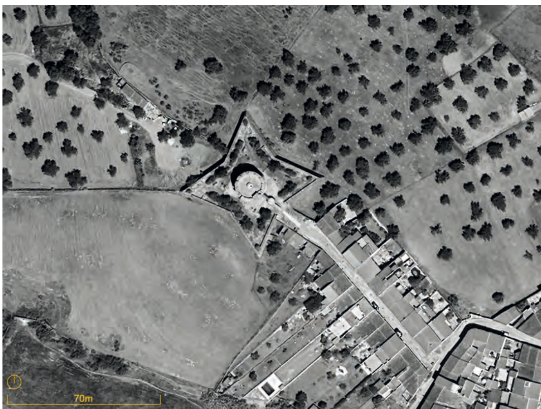
Figura 6. Vista aérea del Fuerte de San Juan, en Encinasola, Extremadura.