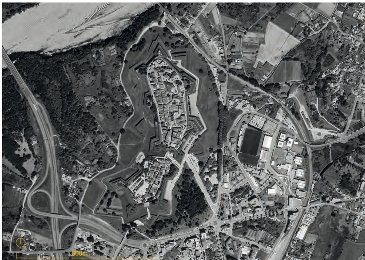
Figura 3. Vista aérea de la Plaza Fuerte de Valença. Fortificación permanente del Subsistema Valença-Tui.

En cuanto a las fortificaciones de campaña (figura 4), varían entre 2 fortalezas (ES), 24 fuertes (17 PT y 7 ES), 7 fortines (5 PT y 2 ES),