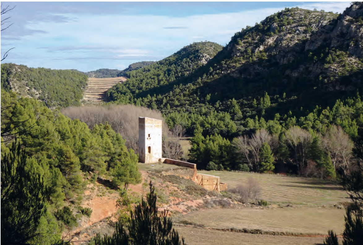
Figura 4. La Torre Piquer (Berge) se mantiene exenta, con el caserío situado en la base de una pequeña elevación.