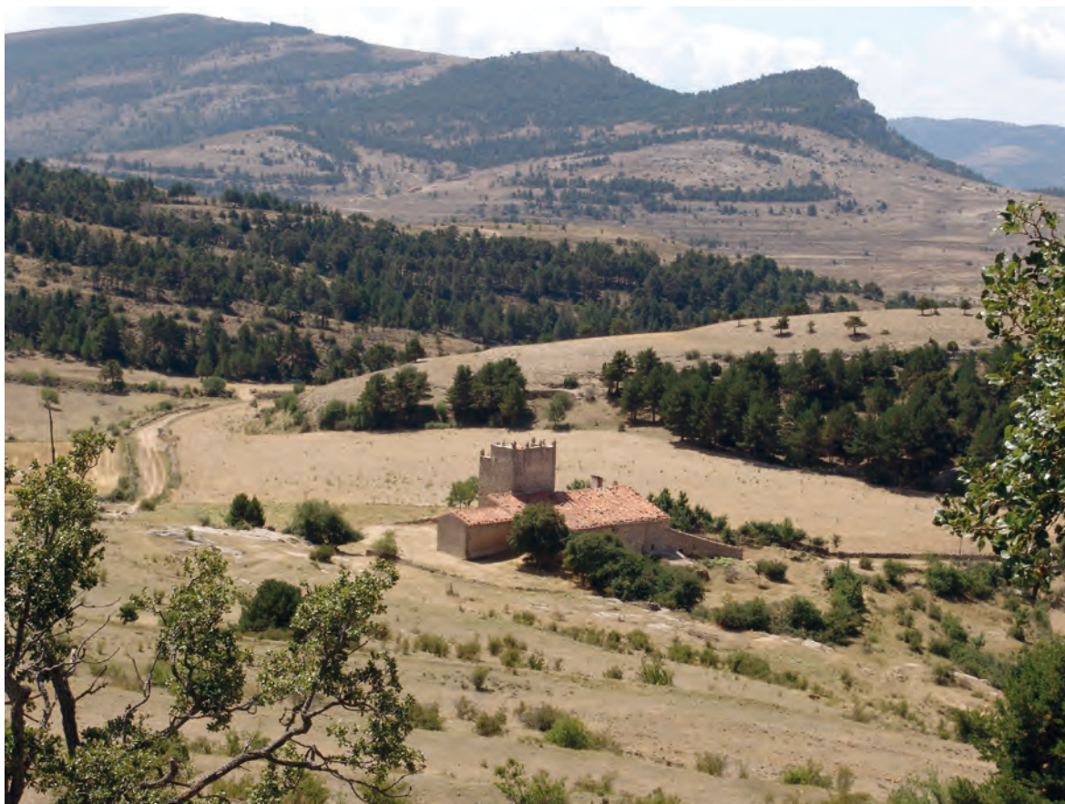
Figura 6. Torre Pintada de Puertomingalvo, paradigma de masía torreada del siglo XVI.

rasgos diferenciales de la torre (fig. 6 a ) respecto a otras potenciales estructuras de apariencia turriforme. Y se evita que la masía fortificada quede diluida dentro del ámbito masovero, manteniéndose el discurso sobre el origen del linaje familiar. Este proceso de cambio no es uniforme, como lo demuestra el hecho de que en el siglo XVI se siguieron construyendo masías fortificadas con remate almenado.