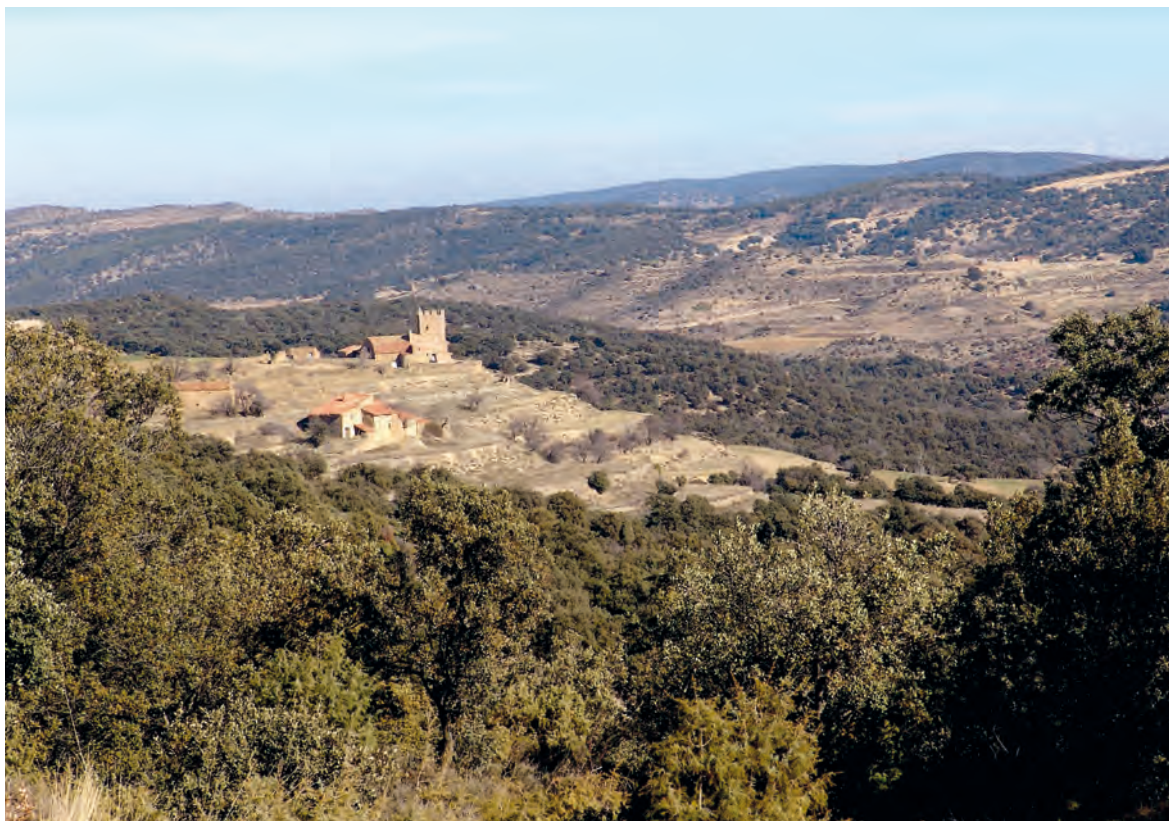
Figura 1. Torre Santa Ana (Mirambel), que recibe el nombre de la ermita integrada en el conjunto. La variabilidad del “paisaje-mosaico” de las masías fortificadas hace imposible definir un “paisaje-tipo”.

las comarcas del Sur de Aragón durante más de siete siglos. Desde ellas se organizaron y explotaron hasta 2/3 partes de los recursos agrícolas, ganaderos y forestales de muchos municipios (Ibáñez 2001, Ibáñez 2005). Y en el caso del mas fortificado, además de su relevancia dentro del paisaje, ha desempeñado un papel esencial dentro del paisaje simbólico e ideológico de muchos sectores de este territorio (Ibáñez 2007; De la Torre 2012).