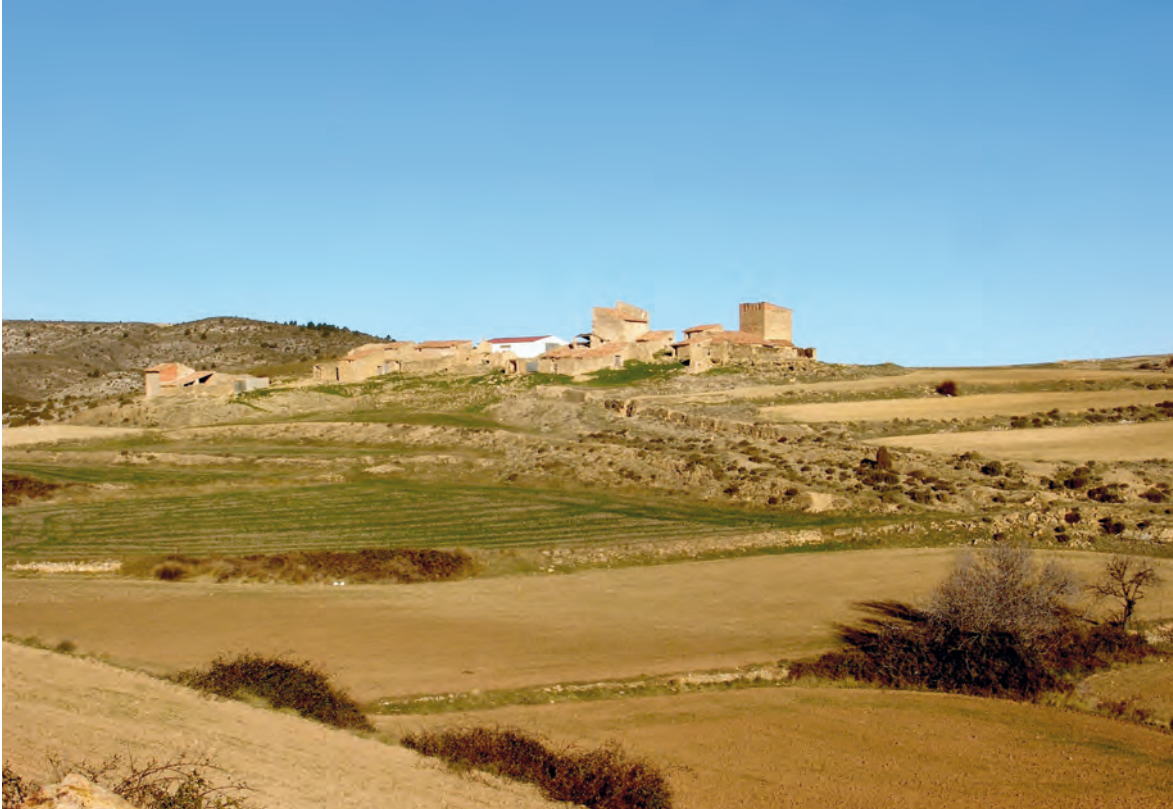
Figura 3. Fuente del Salz (Castellote), situada en una suave elevación, junto a un importante cruce de caminos. Está formada por un amplio caserío, que integra edificios de apreciable calidad arquitectónica.