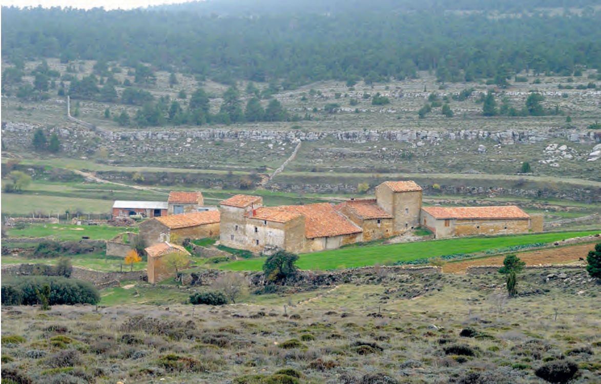
Figura 2. La Torre los Giles (Mosqueruela) tiene asociadas unas 380 ha, en su mayor parte de pastos y usos forestales. Se sitúa junto al camino (y vereda) que va de Mosqueruela a Villafranca del Cid y tiene asociada la Ermita de la Virgen de los Desamparados.

cluida la utilización de elementos de la arquitectura formal (Casabona e Ibáñez 2008).