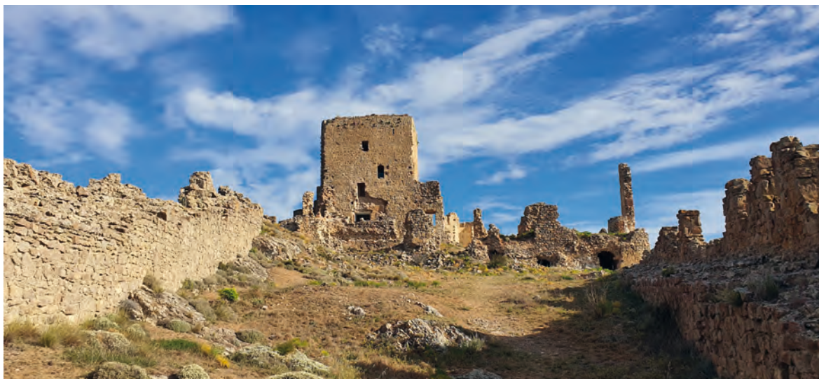
Figura 5. Vista sur del Castillo señorial, desde la Albacara. 2022.

ces hasta ahora, fechas en las que llegan a congregarse miles de personas.