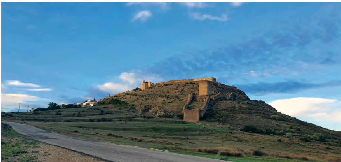
Figura 6. Vista noreste del Conjunto Histórico-Artístico con la Coracha y sus dos Torres en primer plano. 2024.