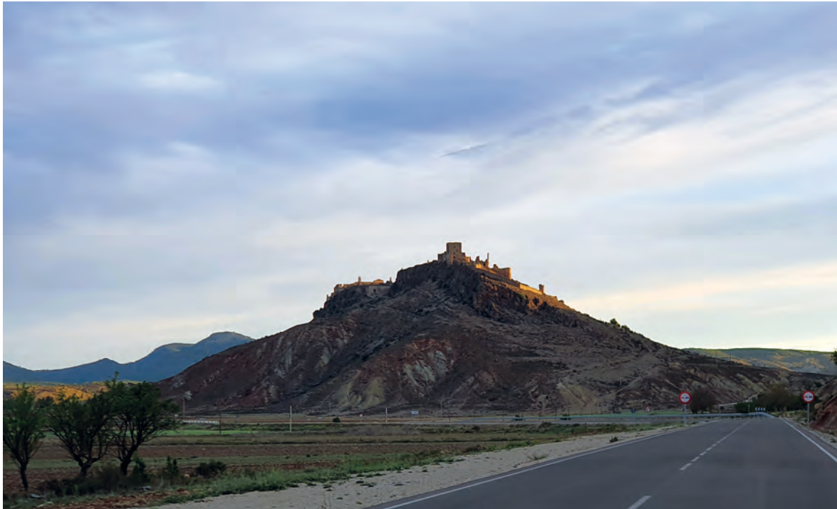
Figura 1. Vista sur del Conjunto Histórico-Artístico. 2024.

repavimentado de las ciudades. En esta centuria atribuímos buena parte de los empedrados moyanos por su disposición en cajones rectangulares, semejantes a otras ciudades castellanas.