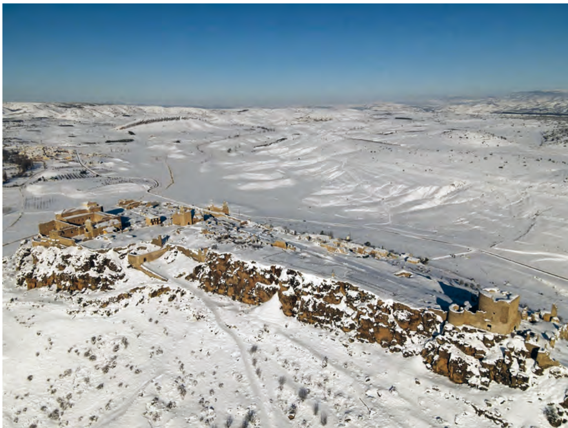
Figura 2. Vista aérea tras el paso de la borrasca Filomena . 2021.

el trazado de la Plaza Mayor, con la Iglesia de Santa María y frente a ella, el Ayuntamiento y Pósito. Conserva algún elemento de escena urbana, como el empedrado de la calle Real, que conduce a la Plaza.