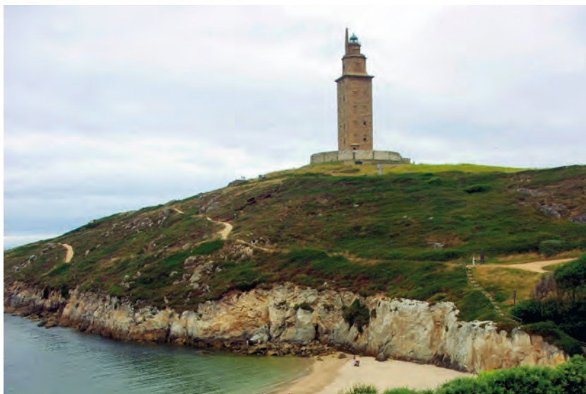
Figura 1. La Torre de Hércules desde la ensenada de la Lagoa, desde donde aún es posible apreciar una buena integridad del paisaje en que se sitúa.

La noción del pasado del monumento, aún en el siglo XVIII, estaba presidida por leyendas que explicaban la construcción de la Torre de Hércules y su relación a la historia de la ciudad. Su falta de racionalidad se justificaba por evidenciar la remota antigüedad del edificio, y así, legitimar la ciudad. Esta noción cambió con la Ilustración, que combatió la continuidad de esa tradición mítica. Benito Jerónimo Feijoo evidenciaba que la existencia o no de ‘monumentos’ y su calidad son esenciales para ‘dudar’ acerca de dicha tradición, así como su antigüedad (1751, 251-52, t. II). A su vez, la Real Academia de la Historia (RAH) jugaba un papel esencial, fundada en 1738 para el “cultivo de la Historia, para purificar y limpiar la de nuestra España de las fábulas que la deslucen” (Novísima recopilación 1803, 168).