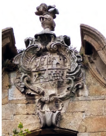
Figura 3. Escudo de la familia Cornide coronando la casa de A Coruña, su posición protagonista como único elemento ornamental de su fachada nos hace comprender el enorme peso de estos elementos en la legitimación de la nobleza durante el siglo XVIII.

Otro elemento de interés, en el fragmento previo, es la identificación de la Torre con el escudo de A Coruña. A este respecto, baste apreciar la escenográfica posición central del escudo de la familia Cornide en su casa prin-