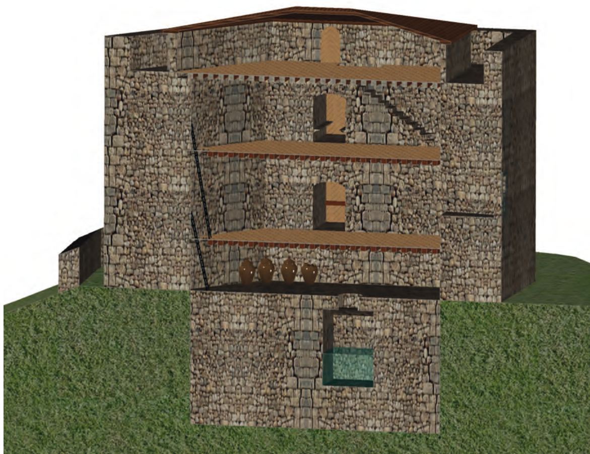
Figura 6. Recreación. Sección plantas y aljibe

menara podemos establecer las conclusiones siguientes: