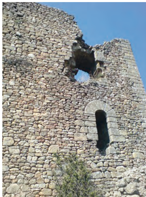
Figura 4. Puerta de acceso a la torre (desde el exterior)