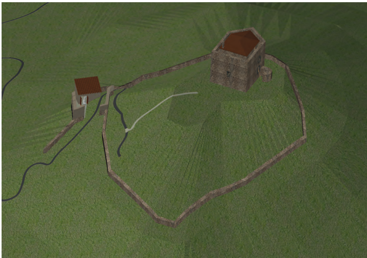
Figura 5. Recreación. Castillo y Murallas