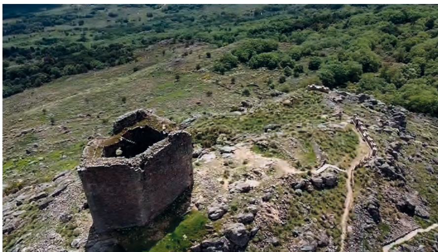
Figura 3. Planta pentagonal

muy detallado, pero en esta comunicación sólo se procederá a la descripción de la fortaleza.