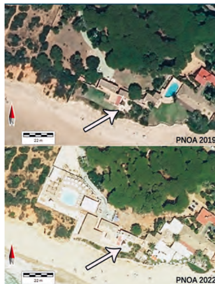
Figura 4. Ortofotos del Plan Nacional de Ortofotografía Aérea (PNOA) correspondientes a los años 2019 y 2022 del entorno geográfico de la Torre Bermeja, en las que se aprecian las alteraciones sufridas por el inmueble histórico en el contexto de una actuación urbanística vinculada al desarrollo turístico de la zona.