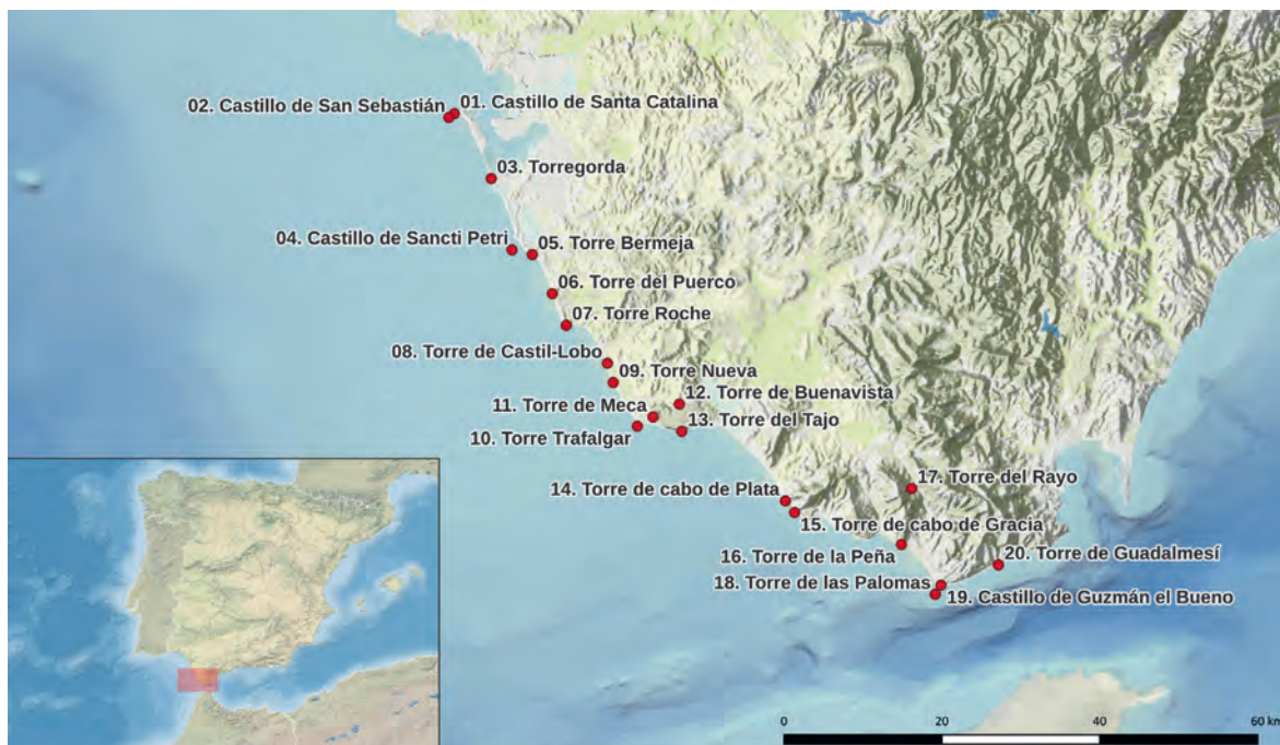
Figura 1. Localización geográfica de los elementos patrimoniales estudiados.

clasificado las estructuras según su comportamiento (basado en la magnitud y el patrón de desplazamiento observado).