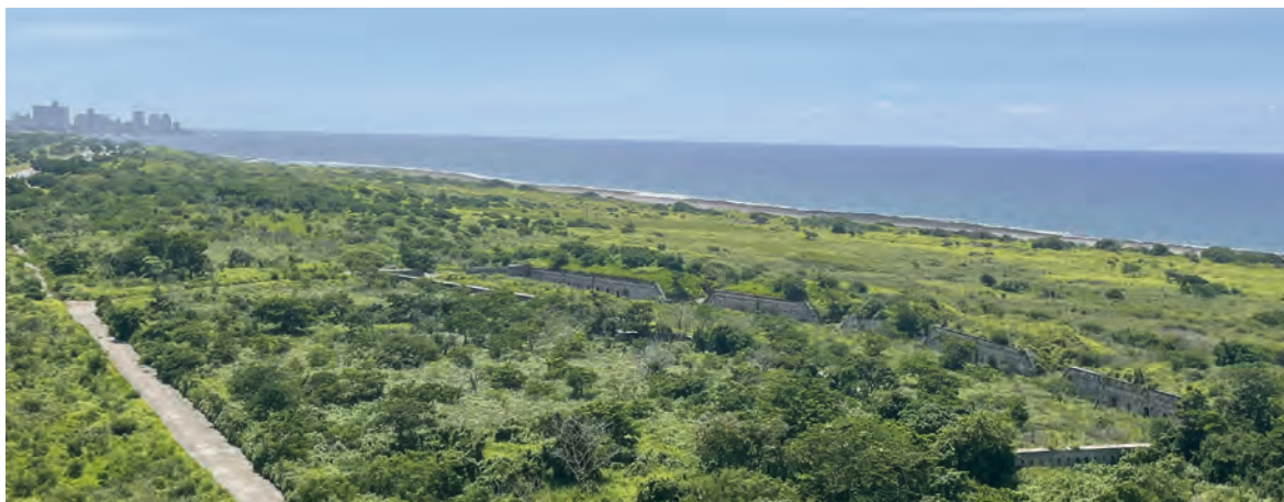
Figura 4. Bateria No. 1. La Habana.

entrada del puerto. Pero en adelante, serán frecuentes las peticiones de construcción de obras defensivas, lo cual evidencia que las existentes no eran suficientes para la eficaz defensa de la ciudad.