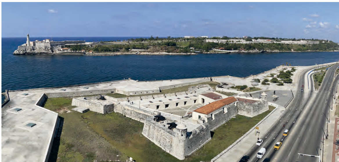
Figura 2. Fortificaciones de La Habana, Cuba. Castillo los Tres Reyes del Morro, Castillo San Salvador de la Punta.

San Juan, escogida porque ofrecía condiciones ventajosas; por el lado norte rodeada de acantilados junto con una cadena de arrecifes que juntos constituían barreras naturales en caso de ataque enemigo y por el interior, una vez entrado al puerto, disponía de una bahía amplia, con abundancia de maderas para ser utilizadas en la construcción y reparación de barcos.