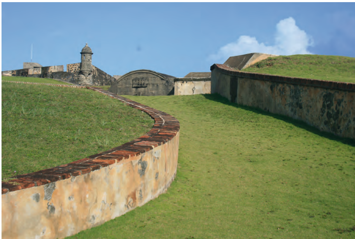
Figura 3. Batería Santa Teresa, San Juan de Puerto Rico.

se identificará como Fuerte del Morro y que hoy día conocemos como el Castillo San Felipe del Morro. A pesar de que la documentación carece de descripción de la obra, inferimos que se trató de un muro a nivel del agua, es decir, localizado en la parte más baja del Morro o promontorio rocoso a la entrada del puerto y cuyo objetivo principal era disparar directamente sobre el muro hacia cualquier embarcación que intentara entrar al puerto.