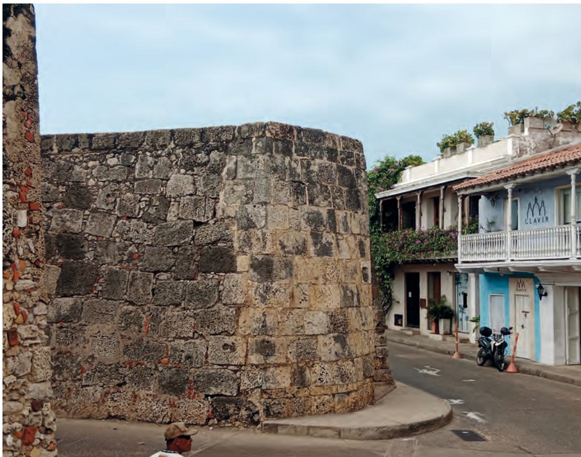
Figura 6. Baluarte Santiago apóstol, integrado en el paisaje urbano de la ciudad.

en el año 1984. Se conserva gran parte del sistema abaluartado de la isla principal, aun siendo derribado el tramo que lo une con Getsemaní, convertido en bulevar que da continuidad a la trama urbana, reconociendo muralla, baluartes, las plazas de la aduana y de la torre del reloj. La complejidad de la ensenada acompaña a través de la historia a la ciudad, que crece sobre el territorio. El brazo de tierra de bocagrande luce altos rascacielos. La isla de Manga sigue comunicada por puentes. Los barcos no cruzan la bocana grande por temor a chocar con la escollera. La población se extiende hacia el aeropuerto situado al norte y tierra adentro hacia el este.