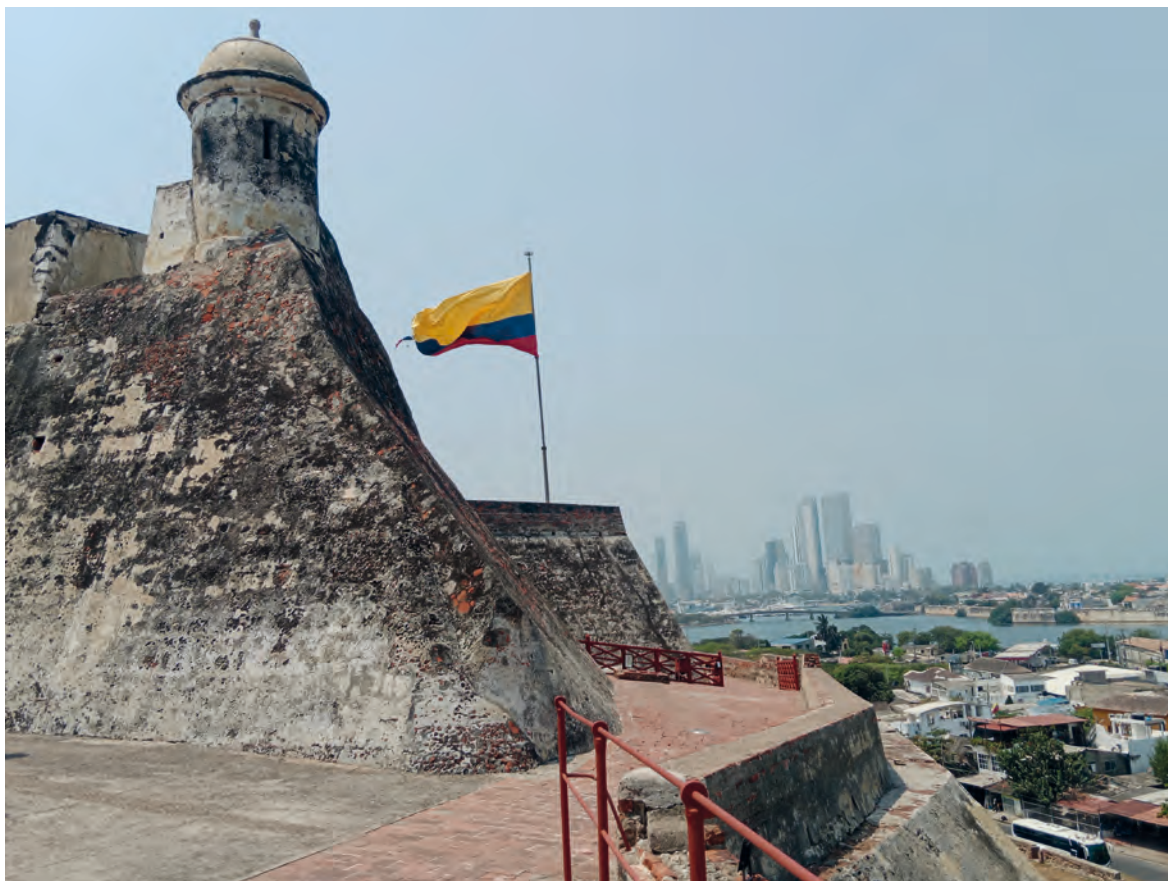
Figura 5. Baluartes de la Fortaleza de San Felipe de Barajas situado sobre una colina permite controlar la ensenada.

Adquiere el título de ciudad en 1574. Tiene su origen en la denominada isla Calamarí, nombre de los habitantes indígenas que allí residían con anterioridad a la llegada de los españoles. La ciudad se extenderá a la isla de Getsemaní. Fuertes de control, vigilancia y defensa se extienden por las diferentes islas que cierran la ensenada, en un proceso continuado en el tiempo. Su sistema de fortificaciones se extiende por toda la ensenada. (Segovia 2009; Blanes 2001)