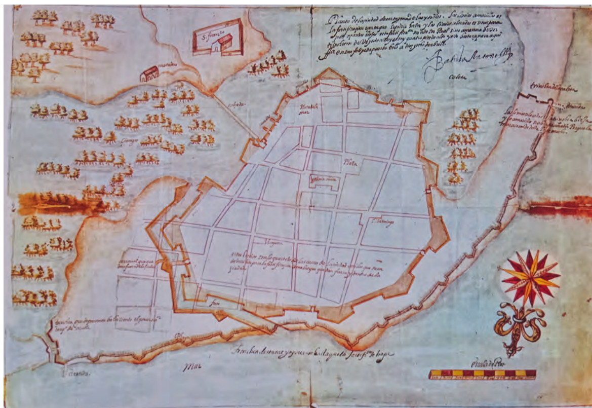
Figura 4. «Planta de la ciudad de Cartagena de Yndias». Bautista Antonelli 1594. Escala de pies 1.000 los 104 mm. Colores rojo, azul, amarillo y verde. 595 x 413 mm. A.G.I. Planos de Panamá, 10 (Patronato 193, R.º 48) T.L, 10. (Sánchez Zurro 1991-141)

fundación el sistema defensivo de la ciudad se extiende territorialmente, se comprueba entre otros lugares siguiendo la línea de la costa hasta la fortaleza de la Chorrera (figura 3), que pareciendo alejada de la Habana Vieja, se comprueba que las edificaciones continúan más allá.