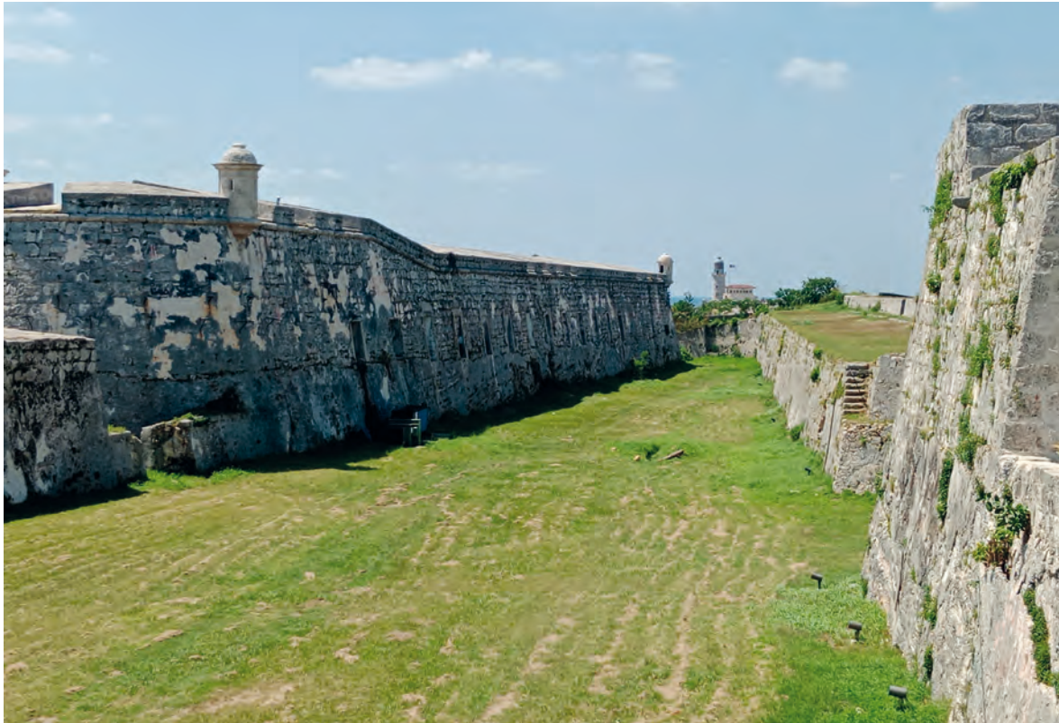
Figura 2. Amplio foso de la Fortaleza de San Carlos de la Cabaña, donde se observa el corte de la roca para descender la cota y ocultarse tras la colina.