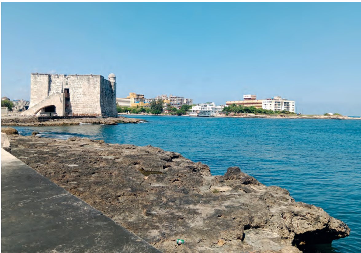
Figura 3. El torreón de la Chorrera en la línea de costa, alejado de la ciudad vieja.