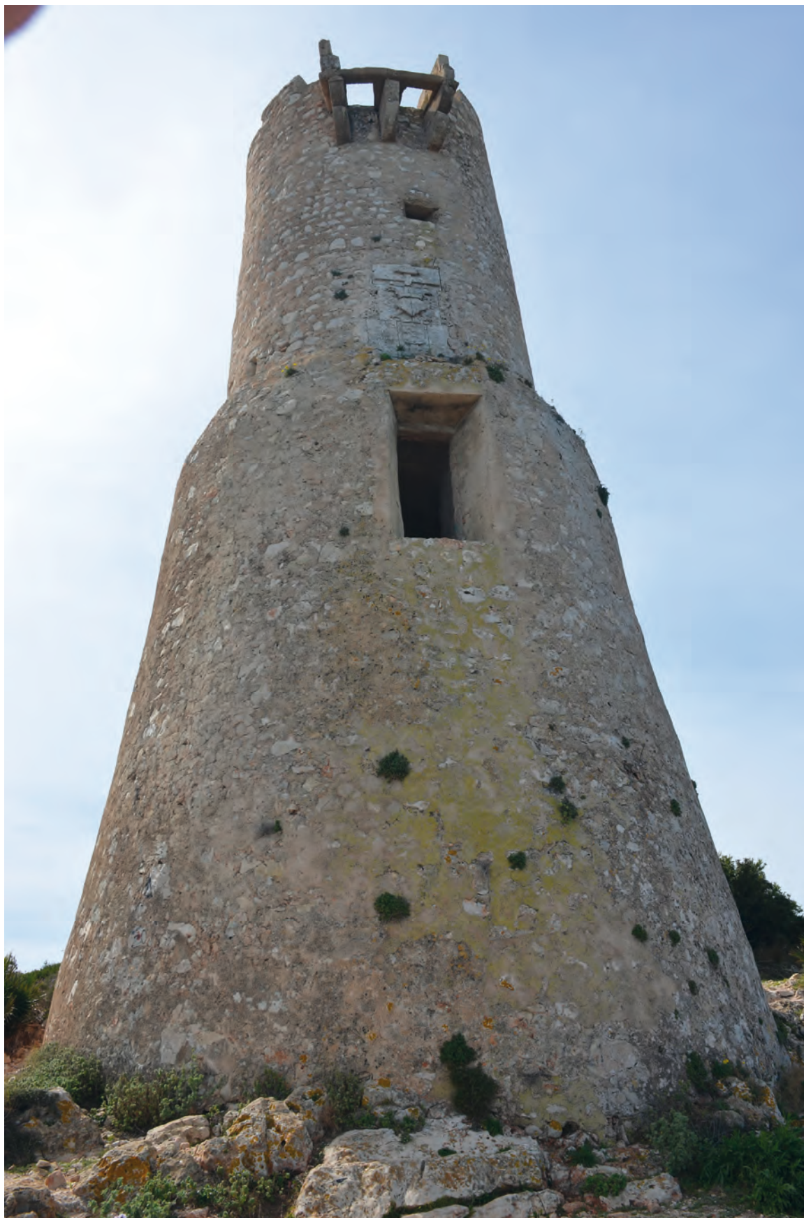
Figura 2. Torre del Gerro, Denia-Alicante.