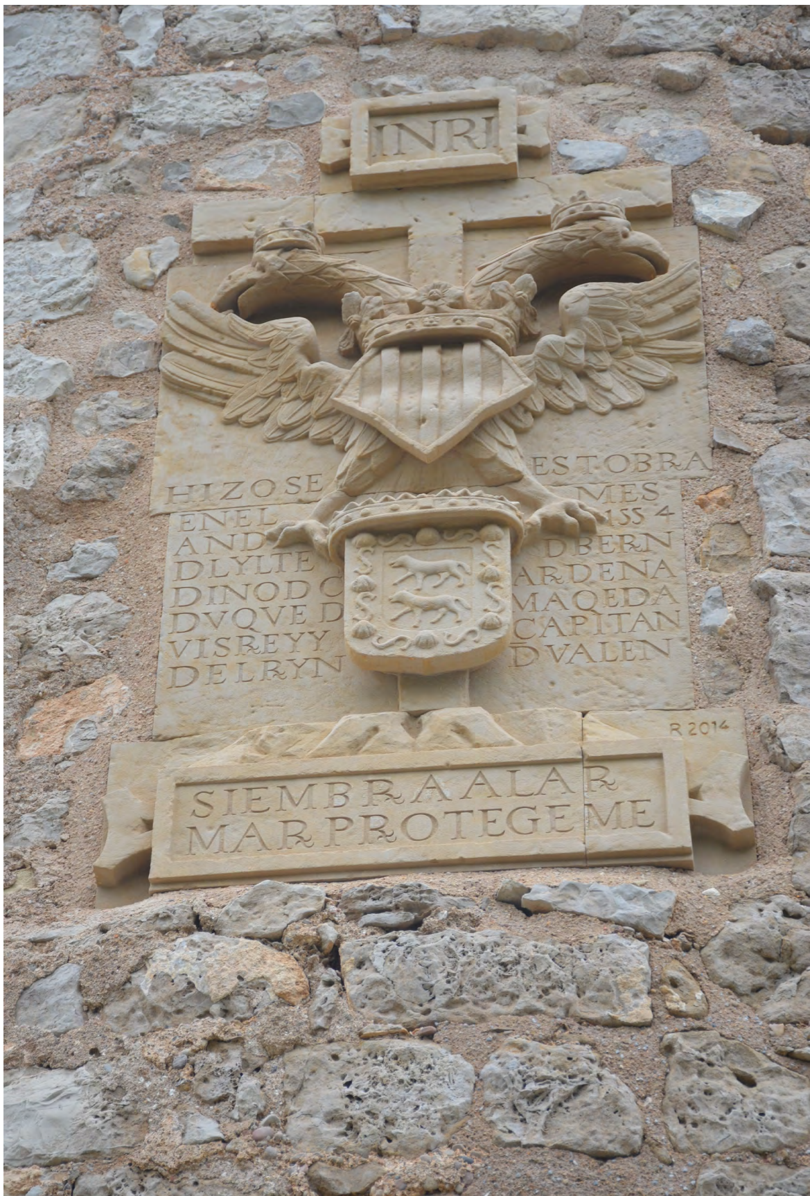
Figura 6. Lápida del duque de Maqueda, en la torre del Badum, Peñíscola-Castellón de la Plana, en el año 2022, tras su errónea restauración.