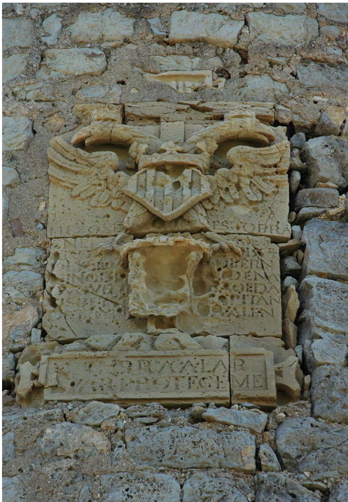
Figura 5. Lápida del duque de Maqueda, en la torre del Badum, Peñíscola-Castellón de la Plana, estado en el año 2009, antes de su falsificación.