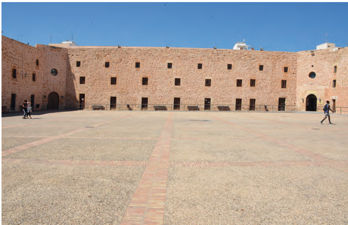
Figura 1. Plaza de armas del castillo de Santa Pola-Alicante (Colección A.G.A.).

El sábado 4-5-1782 Francisco Pérez Bayer, al tratar de geografía antigua, sobre el castillo de Santa Pola, anotó: “Estaba, según parece a la entrada derecha del Puerto Ilicitano para su defensa. Ha más de dos siglos que lo creyó así el que compuso la inscripción siguiente, que se halla sobre la puerta de dicho castillo envuelta en mil cifras y monogramas como la que copié en mi borrador, pero desleída dice así: