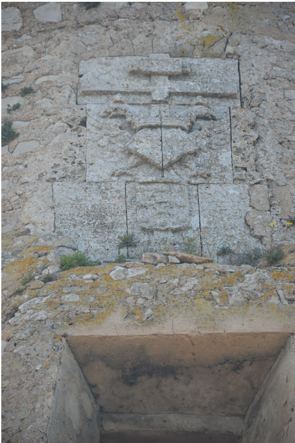
Figura 3. Detalle de la lápida del duque de Maqueda en la torre del Gerro, Denia-Alicante (Colección A.G.A.).