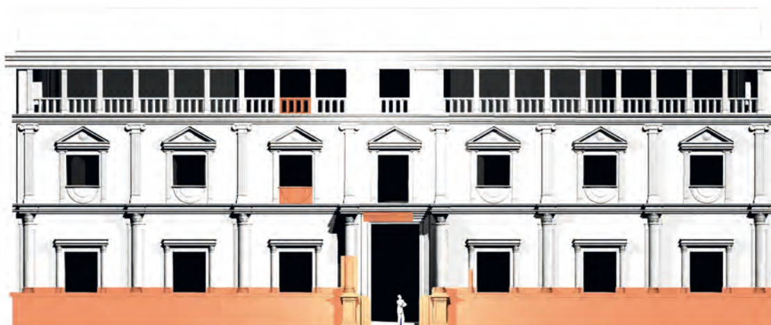
Figura 6. Propuesta de reconstrucción de la fachada del palacio con los restos documentados en la excavación integrados (Zafra, 2017:26).

para el alfeizar de las ventanas (figura 5) destinadas, seguramente, a la segunda planta del edificio, la cual no llegó a ejecutarse. Destacamos tres fragmentos decorativos en relieve con arcos ciegos de medio punto flanqueados por pilastras