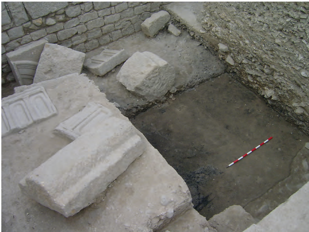
Figura 5. Restos de elementos arquitectónicos y decorativos sin terminar de tallar y/o colocar.