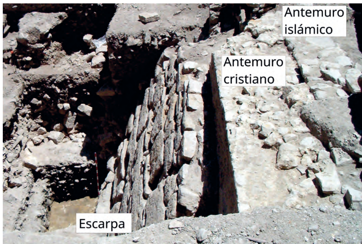
Figura 2. Evolución del antemural del recinto amurallado del Alcázar durante el periodo medieval.

en otras intervenciones arqueológicas realizadas en solares colindantes (Barba, Navarro, 2009).