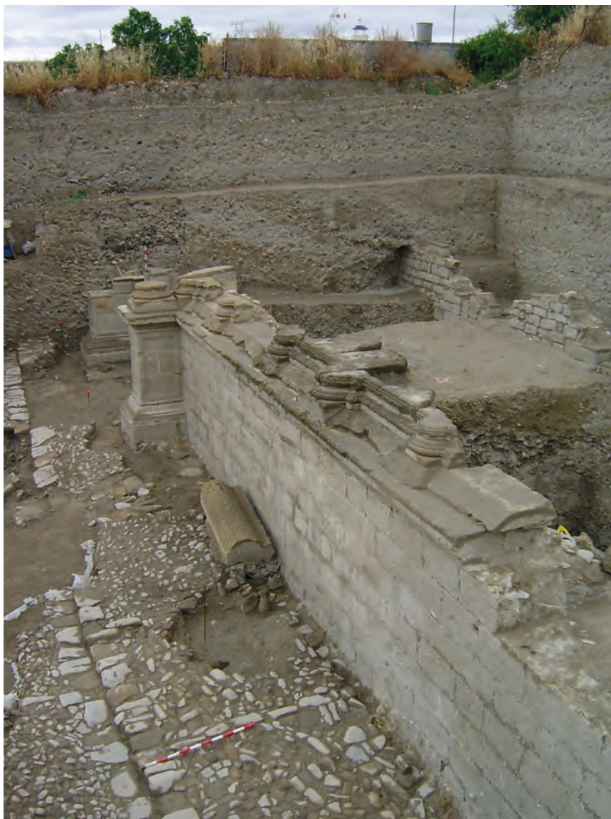
Figura 4. Fachada del palacio de Rodrigo de Orozco.

alzado de tapial, mientras que la fachada se construye íntegramente en sillería. Estaba concebida con una gran horizontalidad y se organiza en siete cuerpos o calles, al igual que los palacios del Deán Ortega y el de Vázquez de Molina situados en la plaza. El gran zócalo o basamento conserva 2 metros de altura y se corona por una moldura corrida a toda la fachada que se caracteriza por tener talón, media caña, falsa escocia y bocel. Dicha moldura marca la limitación del zócalo o basamento, sobre el que se levanta el primer cuerpo o piso del edificio. Sobre la misma se abren los distintos vanos o ventanas que van enmarcados por medias columnas estriadas, de las cuales conservamos tres ejemplares, aunque no colocadas in situ (figura 4).