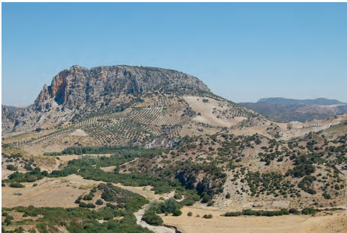
Figura 4. El peñón de Zaframagón.

de peñones escarpados en los que la naturaleza suple las defensas artificiales (Figura 4).