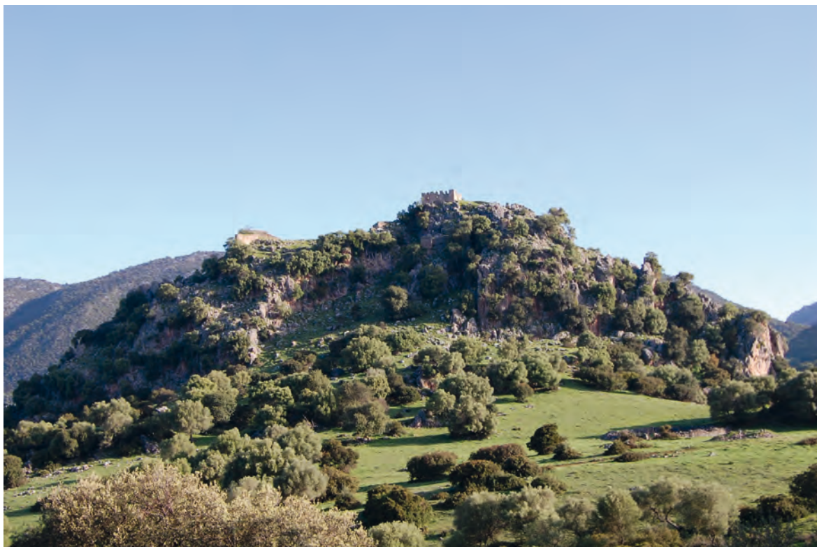
Figura 6. La “villa” de Aznalmara.

(Rosell, 1957, vol. LXVIII) 5 . Con la alcaidía de los Saavedras Gonzalo Arias recibía pagos para el mantenimiento de 250 vecinos (Devís 1999, 130).