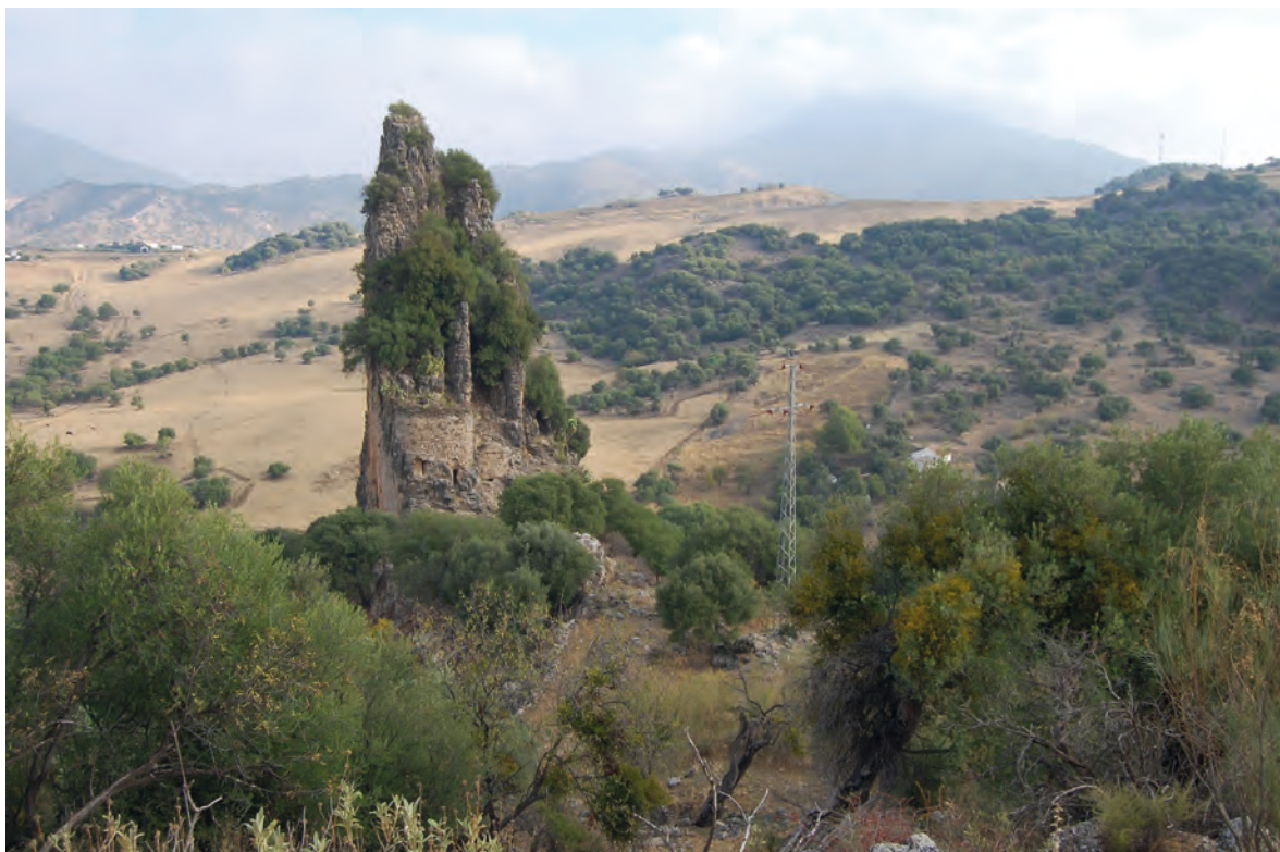
Figura 3. La fortaleza y aldea de Audita.