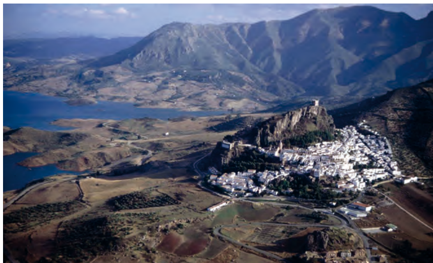
Figura 5. La “villa” de Zahara.

zas. En Zahara, que conocemos bastante bien, la denominada Torre del Homenaje es una obra claramente cristiana (Cobos 2003, 73-75), mientras que en el recinto de la que hemos denominado como Alcazaba alternan torres cuadradas con circulares a partir del siglo XIV, adosándose posteriormente un lienzo de época cristiana de mampostería y tapial con un torreón circular que imita burdamente al nazari/merini preexistente. De nuevo la realidad se nos presenta como bastante más compleja, superando cualquier intento de generalización.