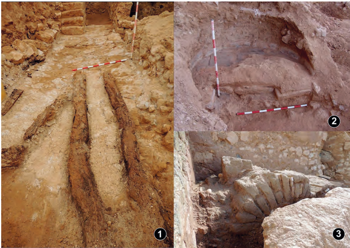
Figura 4. 1. Vigas sobre el pasillo N-S. 2. Horno, 3. Base de la escalera de acceso a la torre (recinto 1).