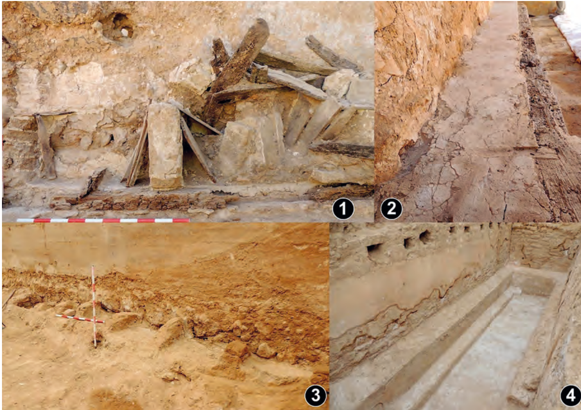
Figura 3. 1. Detalle de la estantería de la sala, 2. Banco adosado en la Sala, 3. Pesebres en proceso de excavación, 4. Aljibe.