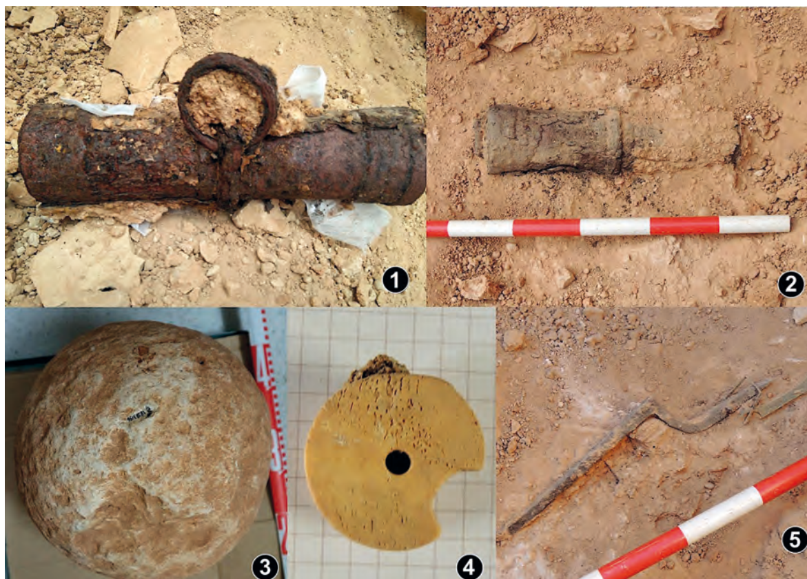
Figura 5. 1 y 2. Recamaras de artillería. 3. Bolardo, 4. Nuez de ballesta, 5. Restos de una ballesta.

2020): recámaras de cañón, restos de ballestas, cascos de hierro, etc. (Figs. 5.1 a 5.5).