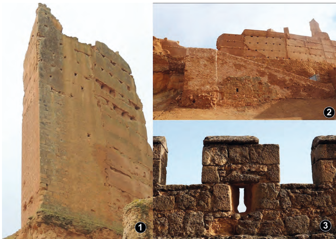
Figura 6. 1. Torre superior. 2. Acceso al recinto 2 desde el 3. 3. Tronera del recinto 4.

feriremos más adelante. Es una estructura trapezoidal, con paramentos de mampostería trabada con mortero de cal, en los que se apreciaban restos de hierros clavados. La base es de un duro mortero de cal blanco, que asentaba sobre un nivel de cantos rodados; se completaba con una media caña, que recuerda las técnicas de la hidráulica romana. Resulta difícil precisar la cronología inicial, dada la pervivencia de técnicas y materiales. En su excavación se ha localizado un fragmento de Terra Sigillata , además de materiales bajomedievales. Una vez perdida la función hidráulica, este espacio ciego pudo ser utilizado como mazmorra.