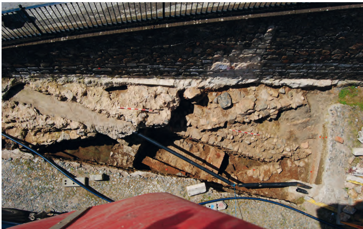
Figura 3. Excavación en Plaza del Plantel con diferentes fases de la muralla y estructuras almohades previas

mente debido a las dimensiones del sondeo en relación con el viario urbano, sin embargo, no podemos descartar la identificación de estos restos con la cerca medieval definida en los documentos del siglo XV.