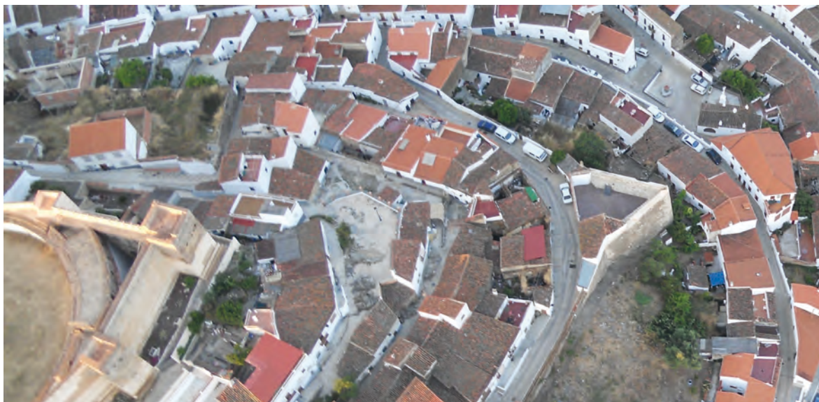
Figura 5. Vista aérea del castillo y Baluarte de la Cota.

arqueológica y el estudio paramental constataron el empleo de una fábrica distinta a la de la muralla, con una edificación menos cuidada, quizás más urgente, con la desaparición de las hiladas de mampuestos regulares nivelados con lascas y pequeños guijarros, sustituidas en los baluartes por una fábrica irregular y con el empleo por primera vez de ladrillos, muchos fragmentados, piedras marmóreas y todo con un patrón irregular. Así mismo, se documentaron mechinales en los baluartes, posteriormente tapiados mediante la colocación de ladrillos o piedras, aunque en el baluarte estrellado que rodea la Torre permanecieron abiertos tanto intramuros como extramuros. En dos de los tres baluartes de la muralla, Cota (Figura 5) y Portillo, se documentaron los niveles originales del adarve, así como varias troneras para la colocación de artillería cruzada, que aún lucían los enfoscados a base de argamasa de cal.