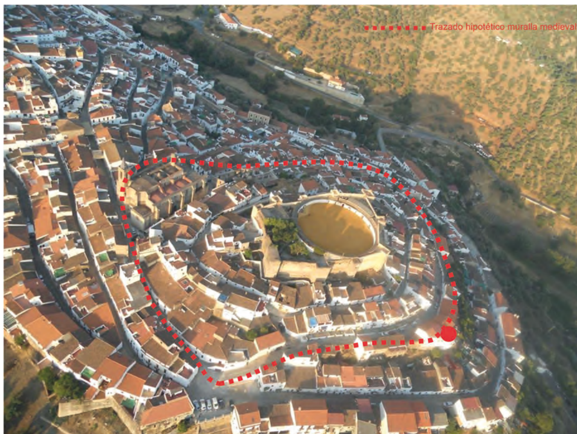
Figura 6. Vista aérea del castillo y su entorno con trazado hipotético de la muralla medieval

órdenes llegadas desde Sevilla, unas 100 casas construidas extramuros y que podían permitir a los portugueses escalar y penetrar en el recinto fortificado 9 .