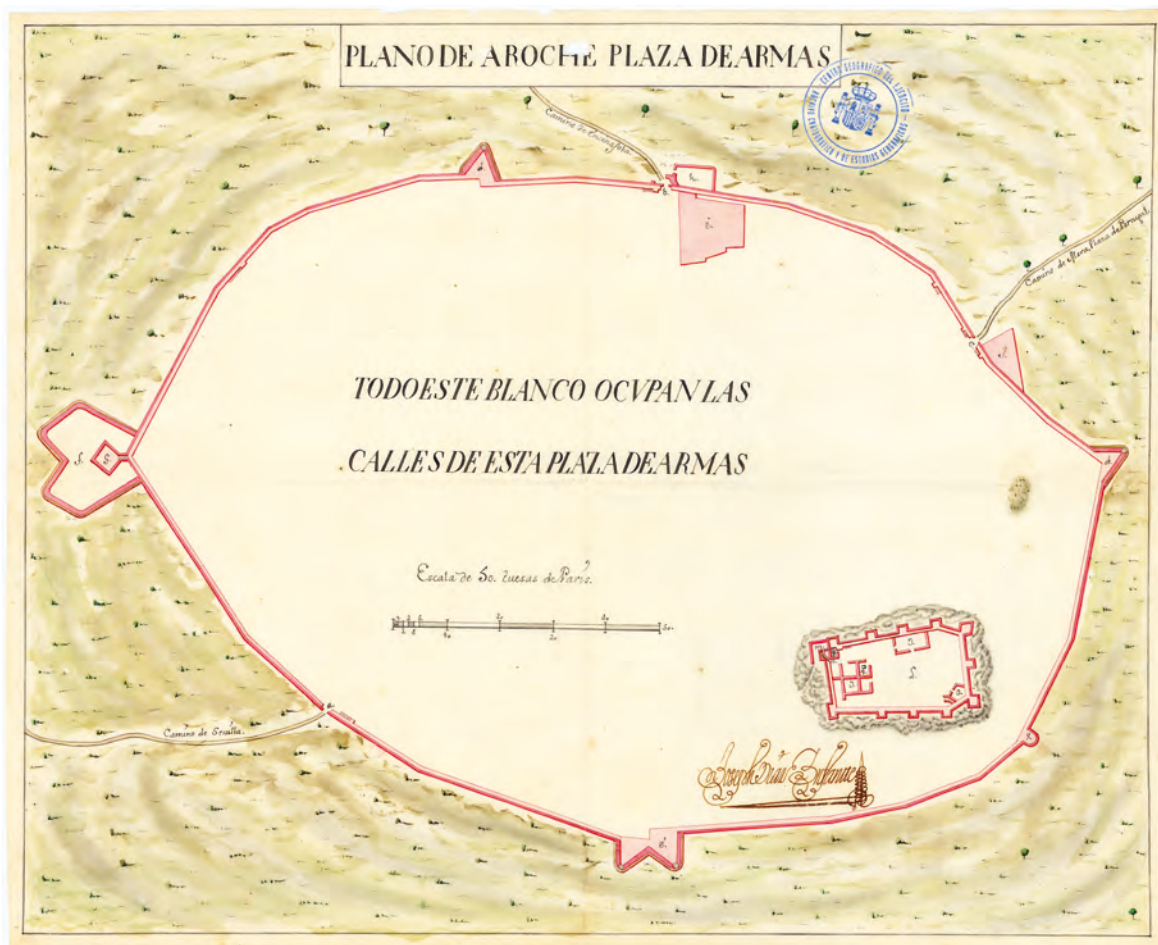
Figura 1. Plano de la muralla y castillo de Aroche por Díaz Infante -1735-

Mientras la descripción de este sistema defensivo resulta sencilla, su proceso de conformación fue más complejo y así lo han desvelado las diferentes investigaciones realizadas como apoyo a su restauración. La Junta de Andalucía a través del Plan de Arquitectura Defensiva de Andalucía fue la responsable de la restauración de los lienzos 1 al 7 del castillo de Aroche, que llevaron aparejados estudios previos históricos y arqueológicos (Medina 2005; Rivera y Romero 2005; 2006). Por otro lado, el Ayuntamiento a través del Proyecto Patrimonio (Medina 2021) ha sido el responsable de la restauración de la Torre de San Ginés, de numerosos tramos de muralla (Medina 2010; 2018) y en la actualidad, desarrolla la rehabilitación de los lienzos 8 al 10 del castillo, que completarían su restauración.