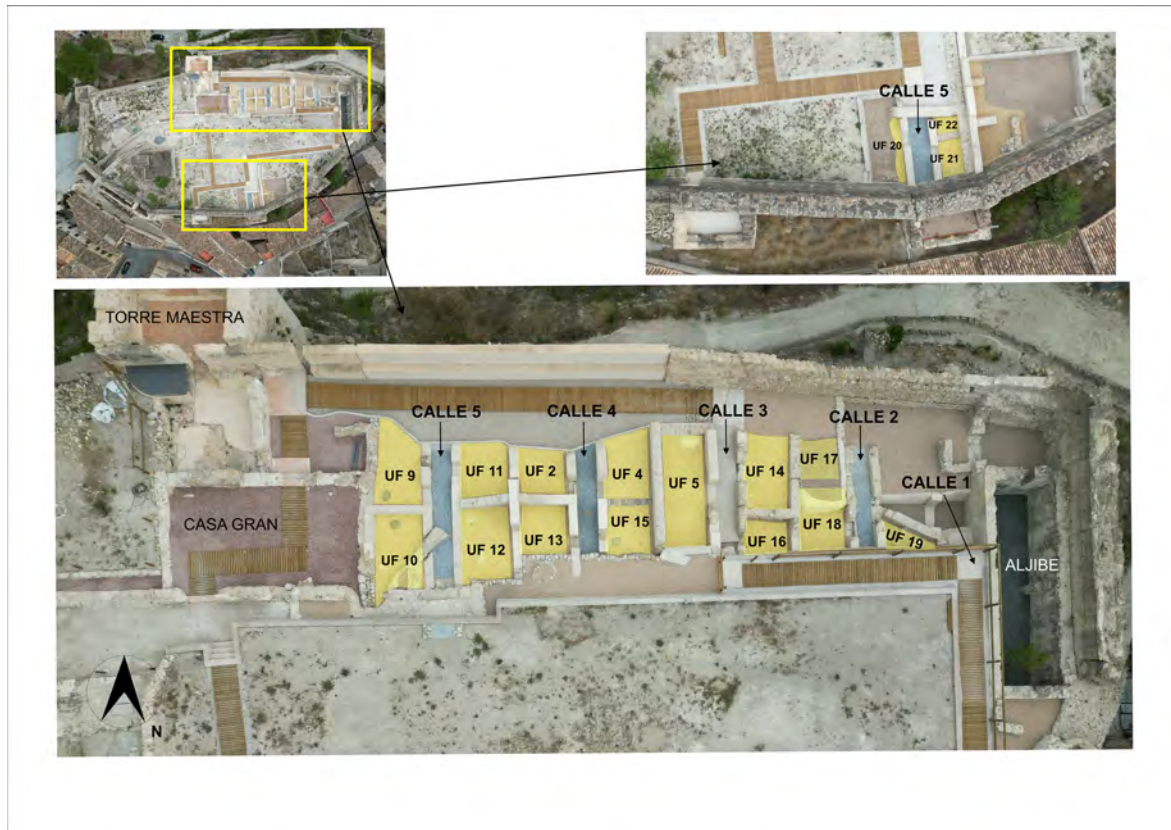
Figura 3. Planta y ubicación de las dos zonas del interior del castillo donde han aparecido los espacios domésticos de época andalusí.

esquina noreste de la fortificación. En la zona sur, se reexcavaron los espacios documentados en la primera intervención de 1995.