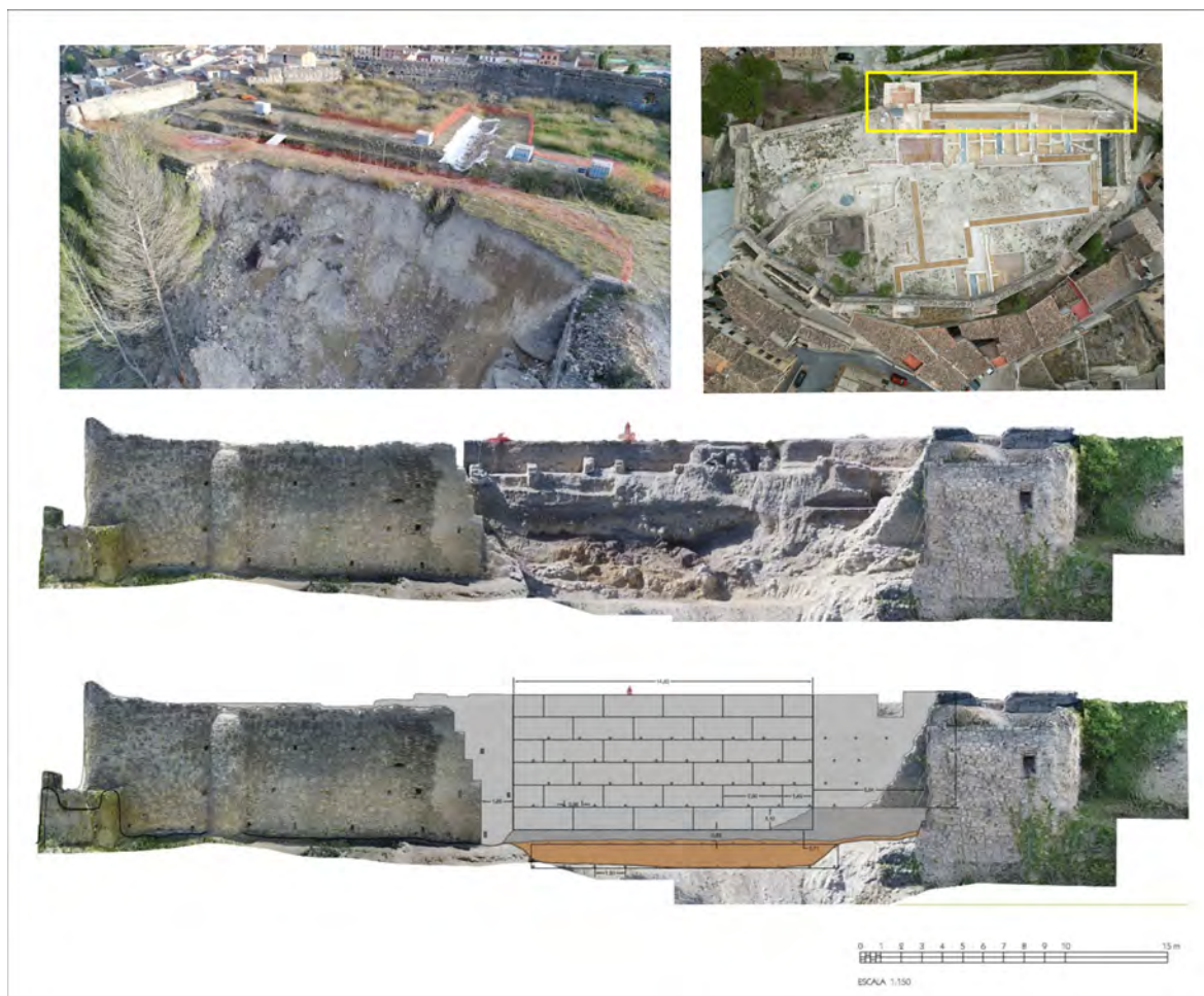
Figura 2. Imágenes del colapso de la muralla norte del Castillo de Planes, producido en el año 2017 con los alzados de la zona saneada después de la excavación y de la reconstrucción proyectada.

Desde el año 2017, la Diputación de Alicante, a través del Área de Arquitectura y del MARQ Museo Arqueológico de Alicante, han realizado tres fases de actuación con el objeto de poner en valor, musealizar y abrir al público esta fortificación medieval. Durante la excavación de emergencia realizada en 2017 por el colapso del frente norte (Fig. 2) y bajo los niveles de ocupación de época moderna, se detectó la existencia de una batería ordenada de estructuras contemporáneas con la fundación del castillo durante la última época andalusí (primera mitad del siglo XIII) y feudal del castillo (segunda mitad del siglo XIII-Primera mitad del siglo XIV), confirmando lo que ya se había intuido y publicado durante la actuación preliminar de 1995 (Menéndez 1995, 1996). En la segunda de las actuaciones, 2020-21, los trabajos se centraron en la finalización de la excavación y estabilización