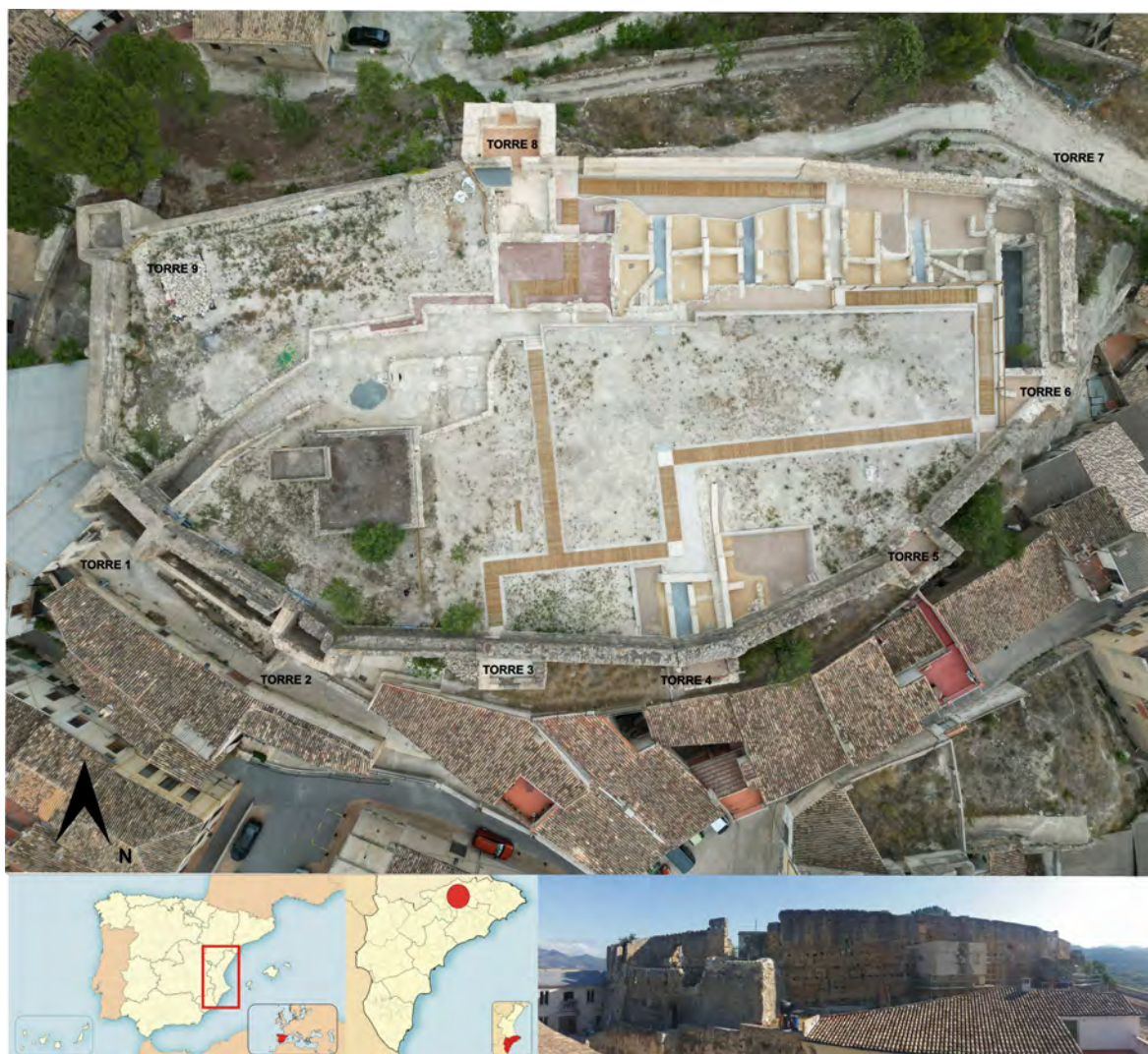
Figura 1. Planta general del Castell de Planes con su localización geográfica a la finalización de los trabajos de la última intervención.

de intervenciones, con el objetivo de musealizar y abrir al público los restos más significativos hallados durante su proceso de recuperación.