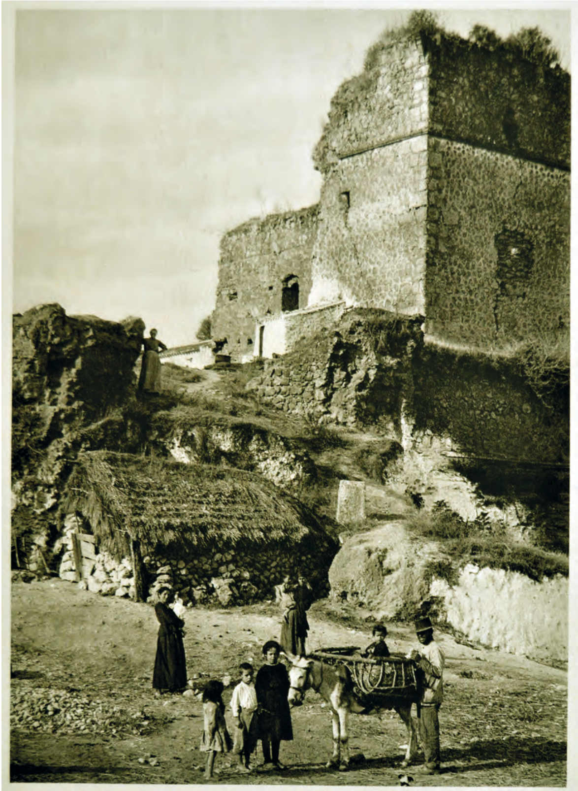
Figura 5. Vista del castillo de Niebla. Kurt Hielscher, Das unbekanntes Spanien: Baukunst, Landschaft, Volksleben , Berlin, Verlag Ernst Wasmuth A.-G., 1922.