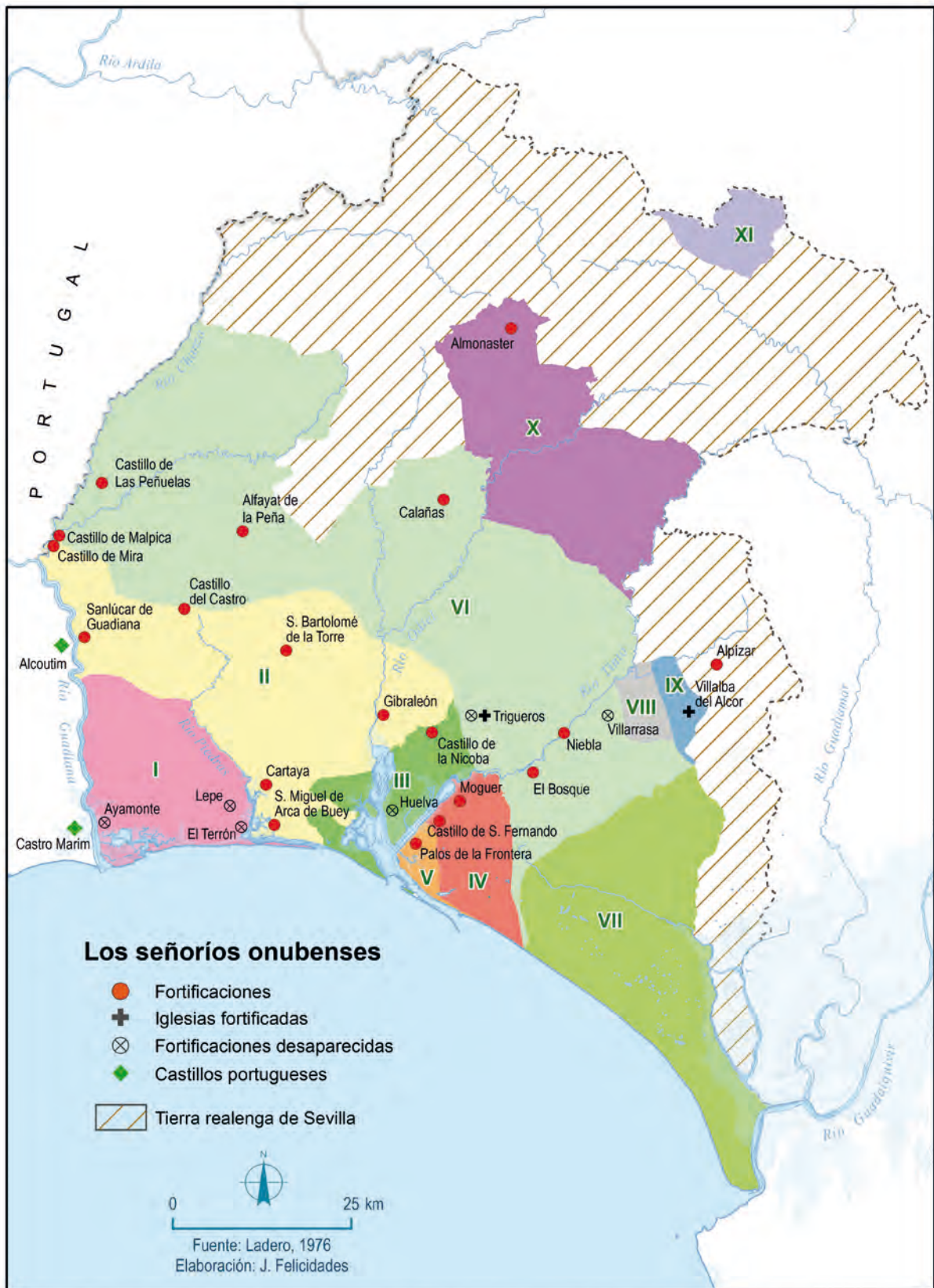
Señoríos en el siglo XV: I. Ayamonte, II. Gibraleón, III. Huelva, IV. Moguer, V. Palos, VI. Niebla, VII. Almonte, VIII. La Palma, IX. Villalba, X. Arzobispado de Sevilla, XI. Orden de Santiago.