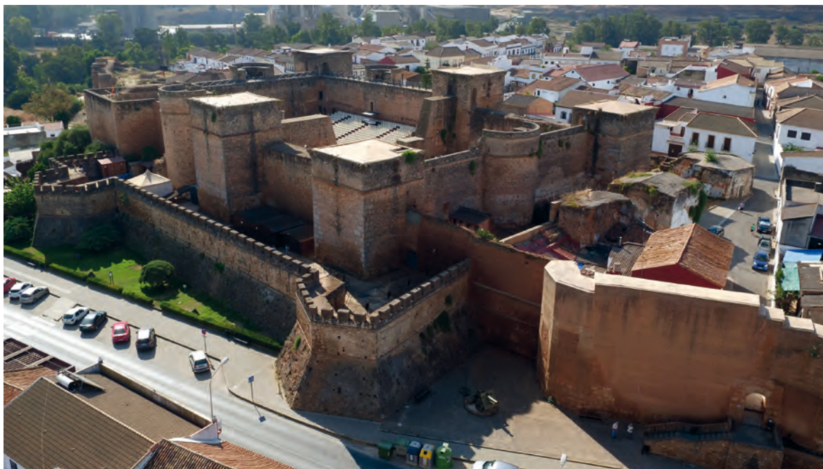
Figura 1. El castillo de Niebla desde el norte, cabalgando sobre la cerca de tapial islámica y con la potente barrera artillera en primer término.

tuciones ni el desarrollo de numerosos trabajos arqueológicos en el núcleo urbano durante los años ochenta y noventa alentaron la investigación histórica de la impresionante fortaleza de los Guzmán (Carriazo 2022, 15-28) 3 .