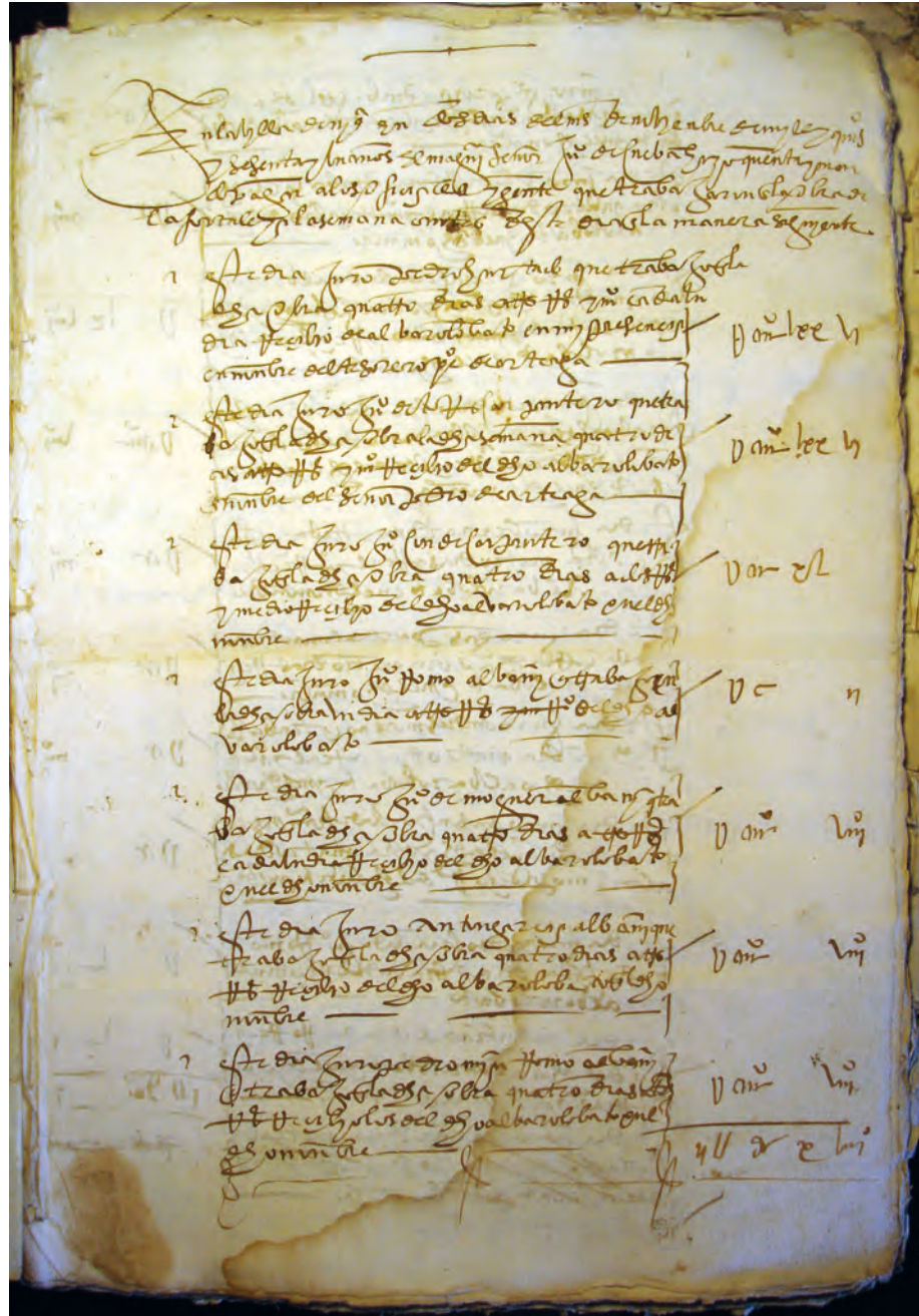
Figura 4. Cuentas de los trabajos realizados en el castillo de Niebla en 1561. Archivo General de la Fundación Casa Medina Sidonia, leg. 347, fondo Medina Sidonia.

francesas durante la Guerra de la Independencia. Finalmente, Enrique Infante Limón, a modo de contrapunto, analiza tanto el último momento de esplendor de la fortaleza que conoció Rodrigo Caro en la década de 1620 (2022a), como el acusado deterioro que experimentó aquella a lo largo del siglo XIX (2022b).