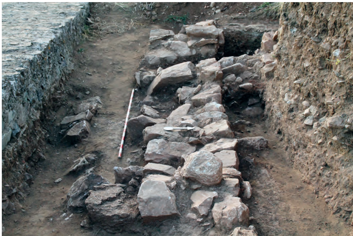
Figura 4. Trazado histórico de la muralla del flanco Sur junto a la reconstrucción de los años 70

“el alcayde e omes que a de tener en el dicho castillo” y “la gente que con él lo velan e guardan”, señalan la existencia de una guarnición militar que necesitaban estructuras habitacionales, almacenes y establos (Casquete de Prado 1993). Una serie de construcciones que serían continuamente reformadas, como en 1387: “Por carta de Sevilla fecha III días de enero de I. CCC LXXX VII/ mandaron a Pedro Fernández arrendador del almorarifazgo de Aracena que de los reales/ que deue dela dicha renta/ que de ende a Mendo Gil, Alcayde, para/ adobar la casa que dentro en el castillo del dicho lugar” (Casquete de Prado 1993, 184).