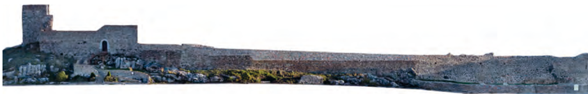
Figura 3. Ortofoto del flanco sur del castillo tras rehabilitación