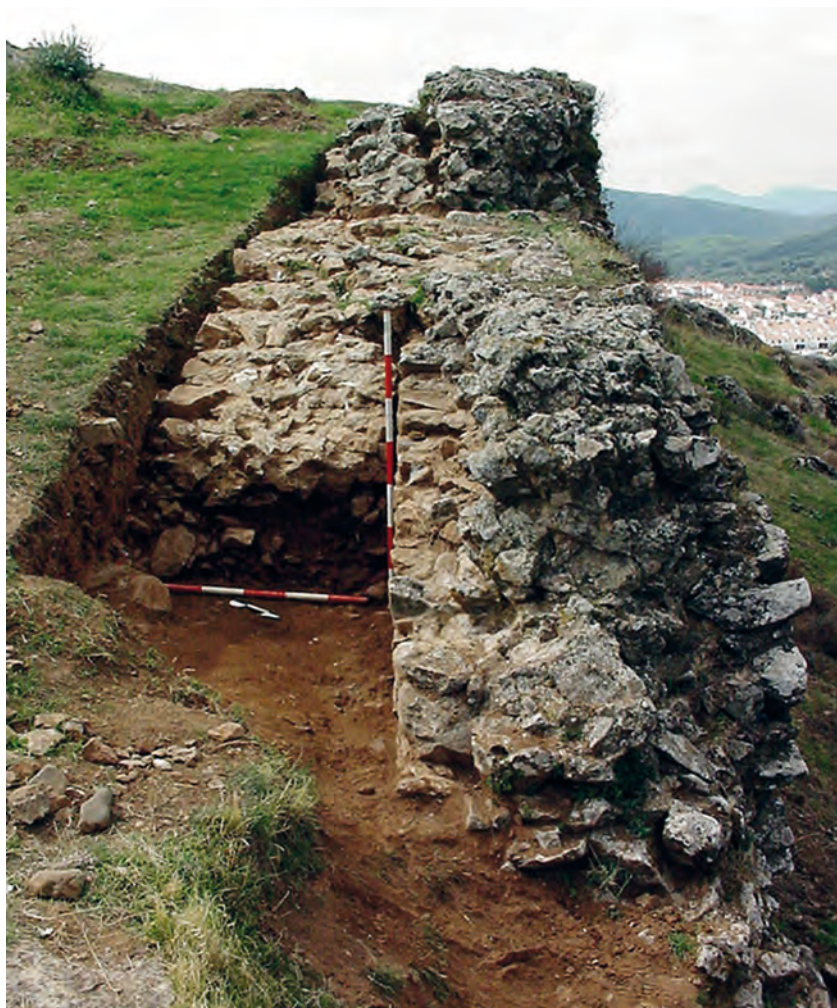
Figura 2. Muralla de la cerca urbana con escalera adosada para el acceso al adarve

bonanza económica y el crecimiento demográfico fueron claves en el crecimiento extramuros de Aracena mientras la villa vieja, de forma paulatina, se fue abandonando y sirvió de cantera a las nuevas estructuras urbanas.