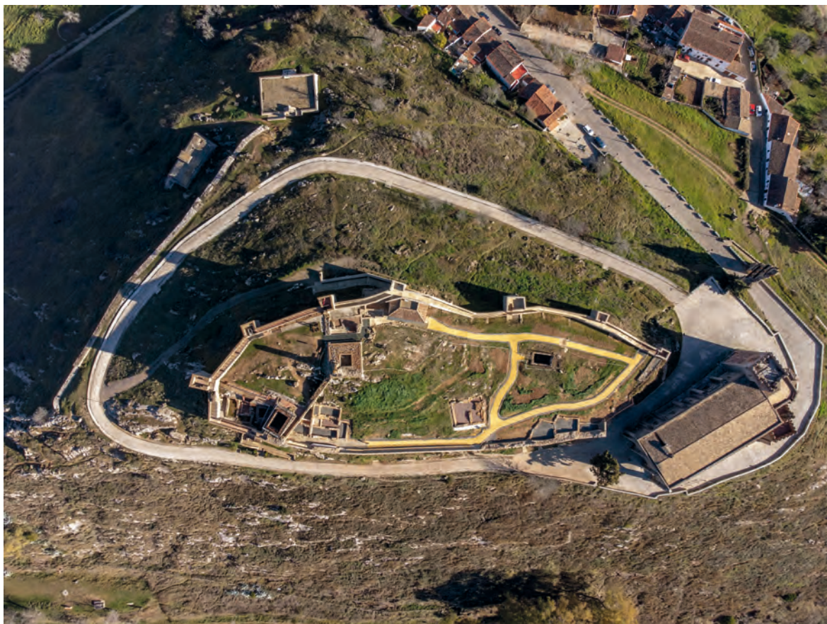
Figura 1. Fotografía aérea de la villa fortificada de Aracena

cerro (Romero, Rivera y Pérez 2010). Se trataba de una cortina defensiva de mampostería careada sin torres defensivas ni contrafuertes, de una anchura media de 1,60 m, con tramos rectilíneos con quiebras que se adaptó a la orografía del terreno (figura 2). La única torre detectada era la que alojaba la puerta de acceso a la villa. Dicha puerta se ubicaba al final de la actual calle Cilla, siendo el primitivo camino de entrada a la villa encastillada. El acceso se insertaba en una torre, conformando un ángulo de 90° con la muralla que serviría de protección a la entrada. La cronología de la cerca debe ser coetánea a la construcción del castillo aunque surgen dudas a tenor de la documentación. La cerca medieval de Aroche constatada en 1406 (Casquete 1993) es definida como la única existente en la comarca (Rey y Sancha 2000), aunque se evidencia la existencia de cercas murarias en Aracena, Torres y Cortegana. Sobre esta localidad se narra en la Chronica del rei d. Joao I , que tras la batalla de Aljubarrota, tropas portuguesas al mando de Antón Vázquez hacen una razzia sobre la comarca y tras un frustrado asalto a Aroche, se dirigen a Cortegana “que es un casti-