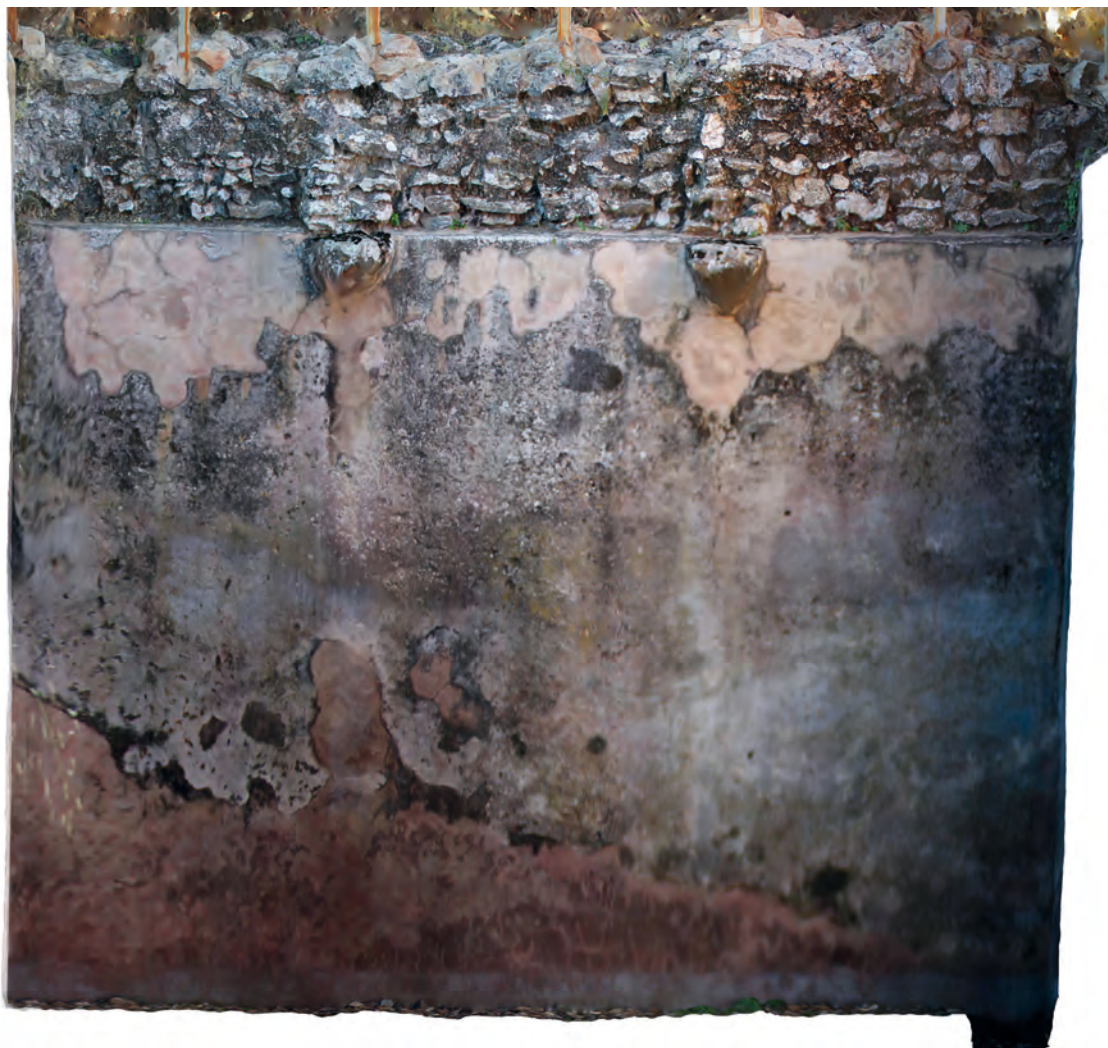
Figura 5. Ortofoto del paramento oeste del aljibe del alcázar con arranque de arcos fajones y bóveda

Además de los datos de obras y el repartimiento militar de ballesteros y lanceros, las citas son concernientes al nombramiento de alcaides y las tenencias que disponían. También nos informan de aspectos como el caso de asalto y ocupación del castillo por los vecinos de Aracena aunque fue recuperado 40 días después por un caballero veinticuatro de Sevilla que lo “cobró e allamó” (Casquete de Prado 1993). En 1464, el cabildo de Sevilla mandaba al de Aracena un repartimiento entre sus vecinos para la guarnición del castillo: “con sus ballestas e carcaxes e viratones e las armas que ovieren menester e a cada uno pertenesçen” (Casquete de Prado 1993, 184). Constan reformas en el castillo desde 1384 hasta 1484 (Collantes 1953; Casquete de Prado 1993) aunque las obras se concentran entre 1386 y 1387, al igual que en otros castillos de la Banda Gallega, ya que se desarrolla un periodo con-