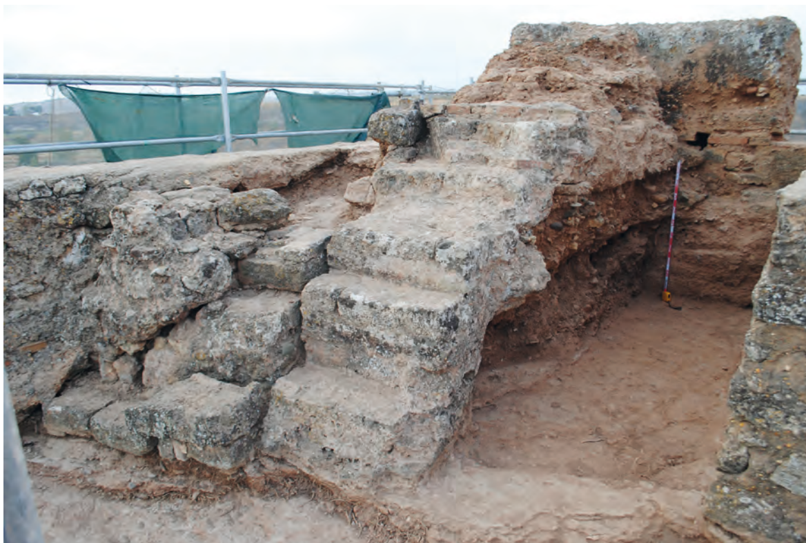
Figura 6. Escalera mudéjar sobre la torre almohade

Las obras de este tipo nos dejan muchas marcas del proceso de ejecución que nos permite caracterizarlas. Unas de ellas son las juntas de obra, que según su disposición e inclinación nos permiten averiguar el orden de construcción de estos módulos y saber cómo se fue levantando la muralla. En el caso de las torres y puertas, las hormas de madera para su ejecución se apoyaban en los esquinazos de cantería que les servían de cierre de cada tramo. La altura de estos cajones es en torno a 90 cm, aunque las hay menores y mayores. Y la longitud en un solo encofrado, uniendo varios módulos, suele ser de 5 a 8 m. Otros restos son las agujas que se utilizaron para sostener los cofres, que en la mayoría de los casos se han descompuesto y nos dejan esos agujeros alineados que denominamos mechinales, con escasos restos de las tablillas, estacas y sogas que los componían.