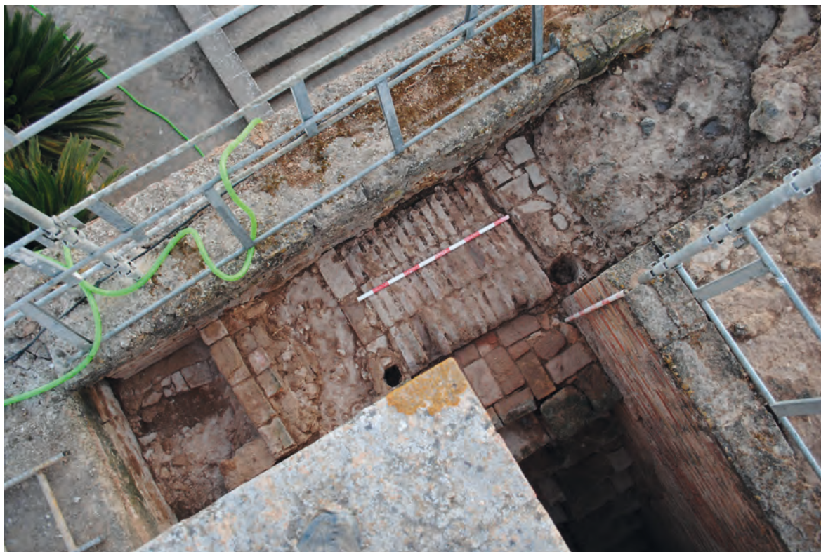
Figura 4. Desembarco de la escalera de la puerta del Buey.