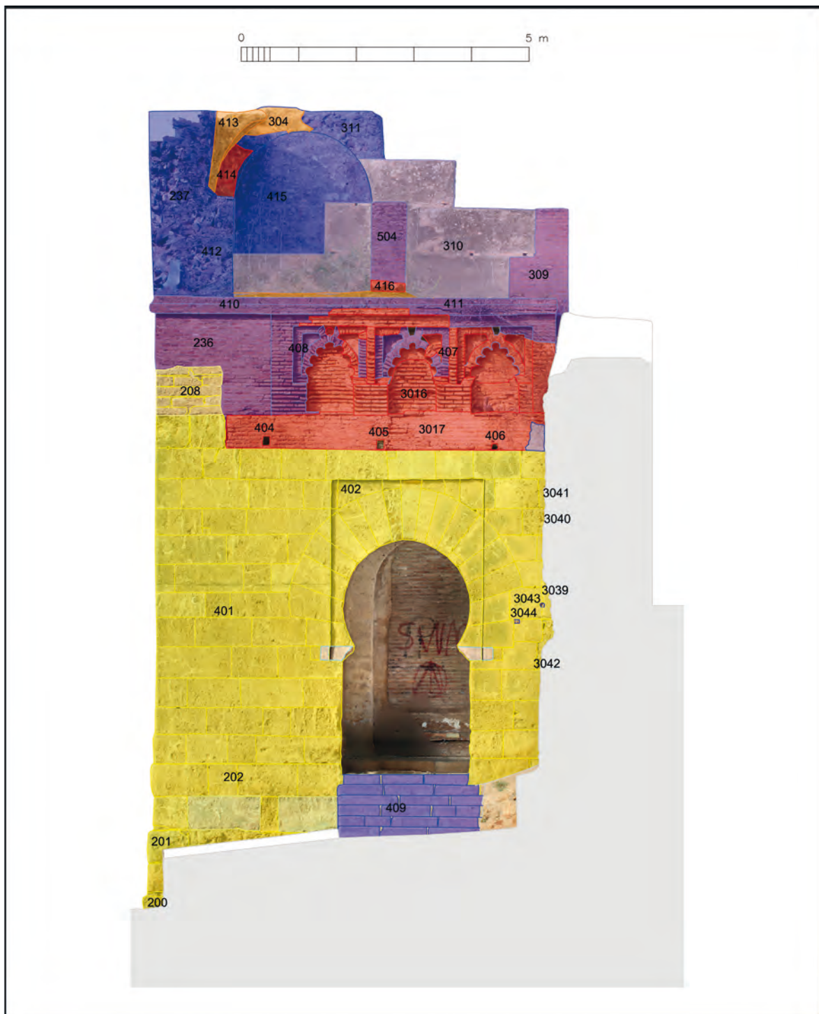
Figura 3. Alzado estratigráfico de la portada exterior (Este) de la puerta del Buey

Dan paso en la parte alta a unas porciones de sillarejo, y sobre ellos, en la puerta del Buey basan unos machones de ladrillo, hasta llegar al límite del primer piso, donde en ambas puertas se desarrollan sendas cornisas de ladrillo.