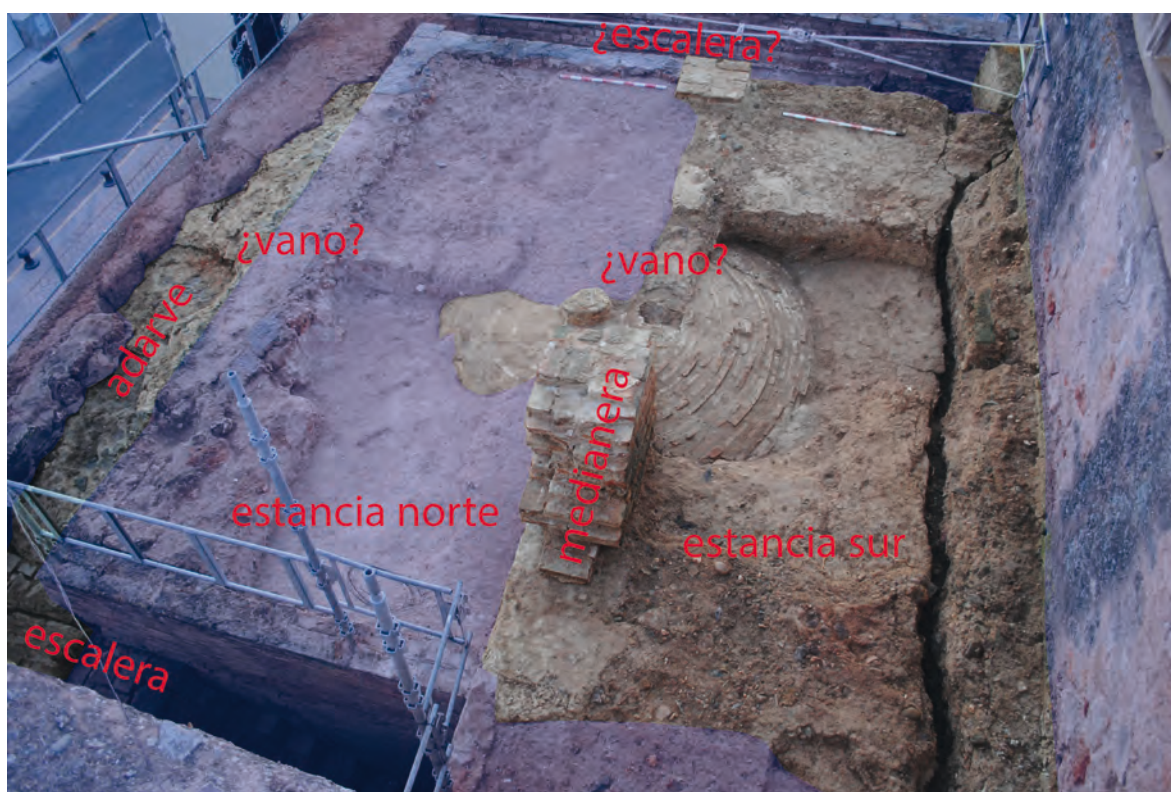
Figura 5. Piso superior de la puerta del Buey. Con sombreado azul las restauraciones