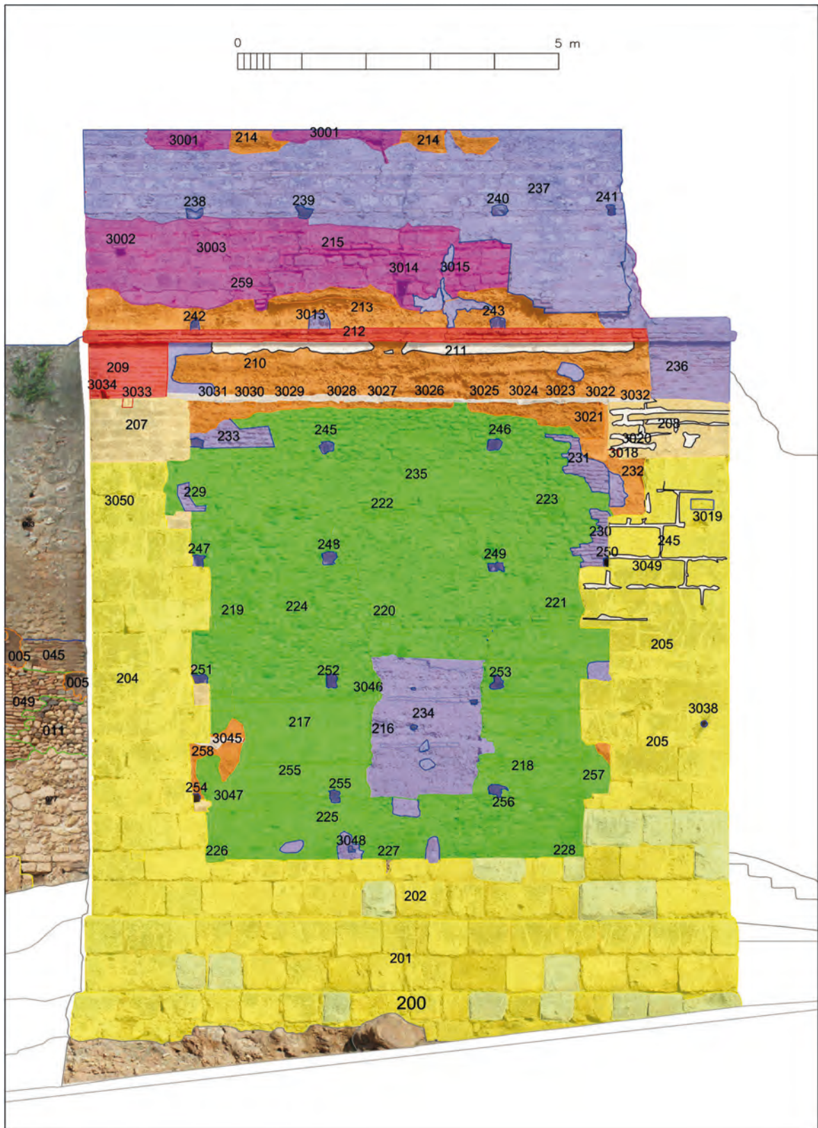
Figura 1. Alzado estratigráfico del frente sur de la puerta del Buey